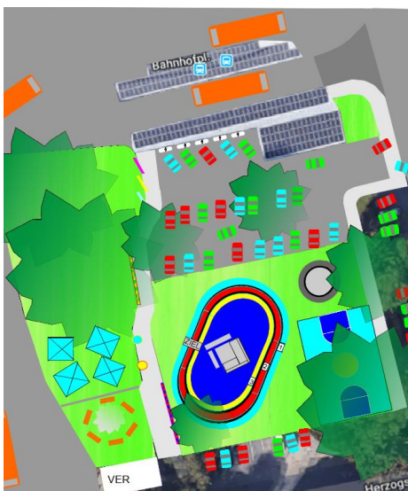
Abbildung 3: Geänderte Planung auf geringerer Fläche