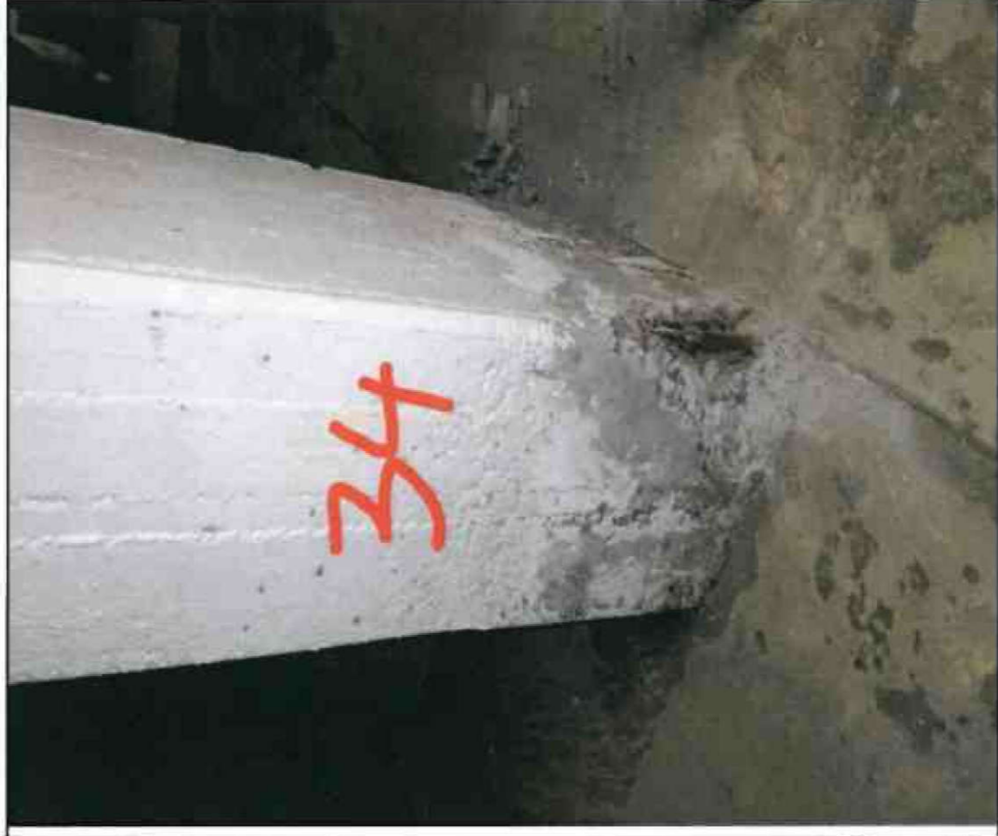
Nr. 34 Stütze