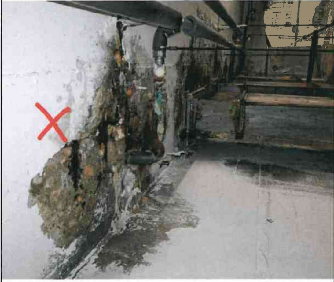
Nr. X Deckendurchbrüche/ Rohrdurchführungen