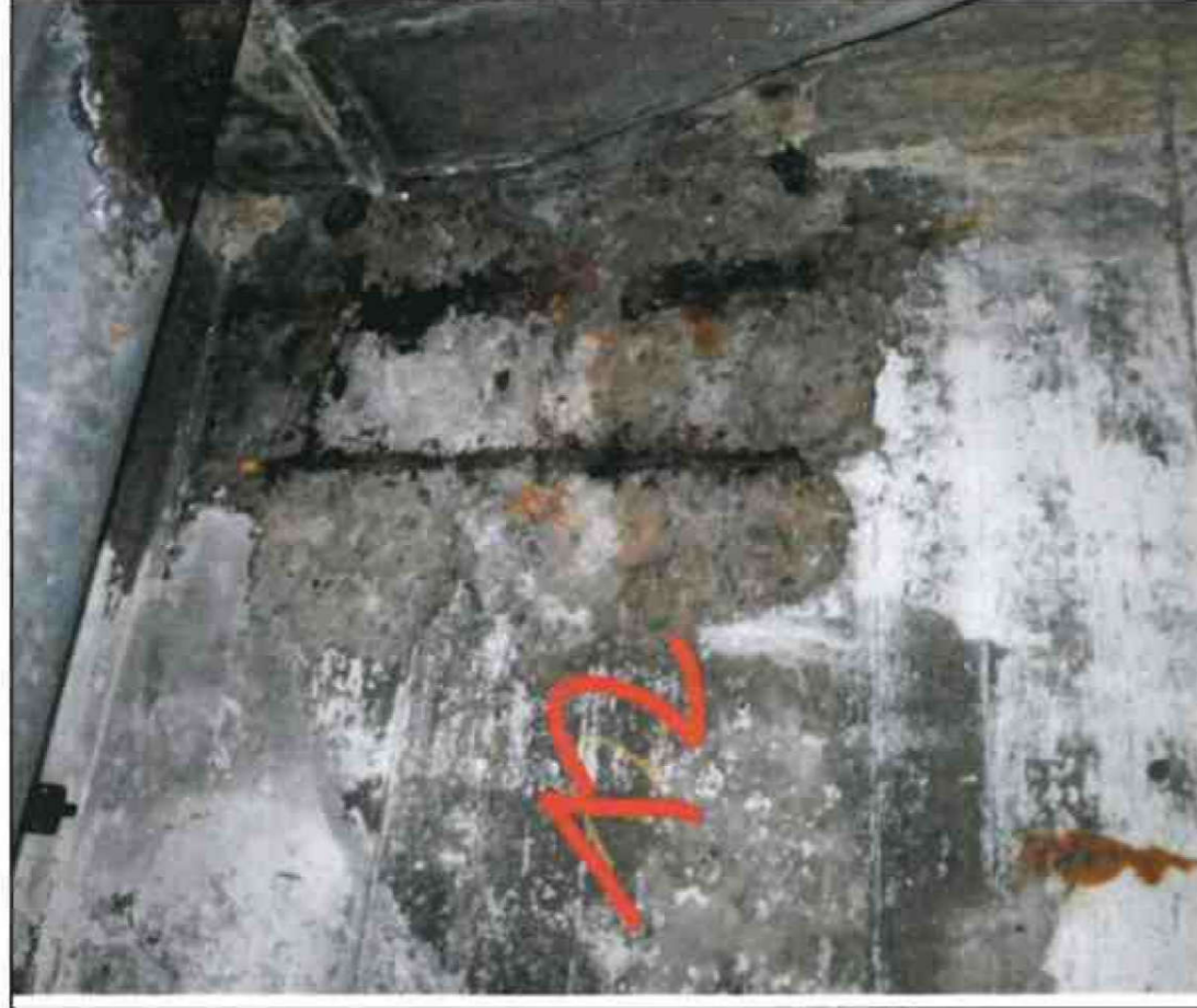
Nr. 12 Außenwand Innenseite