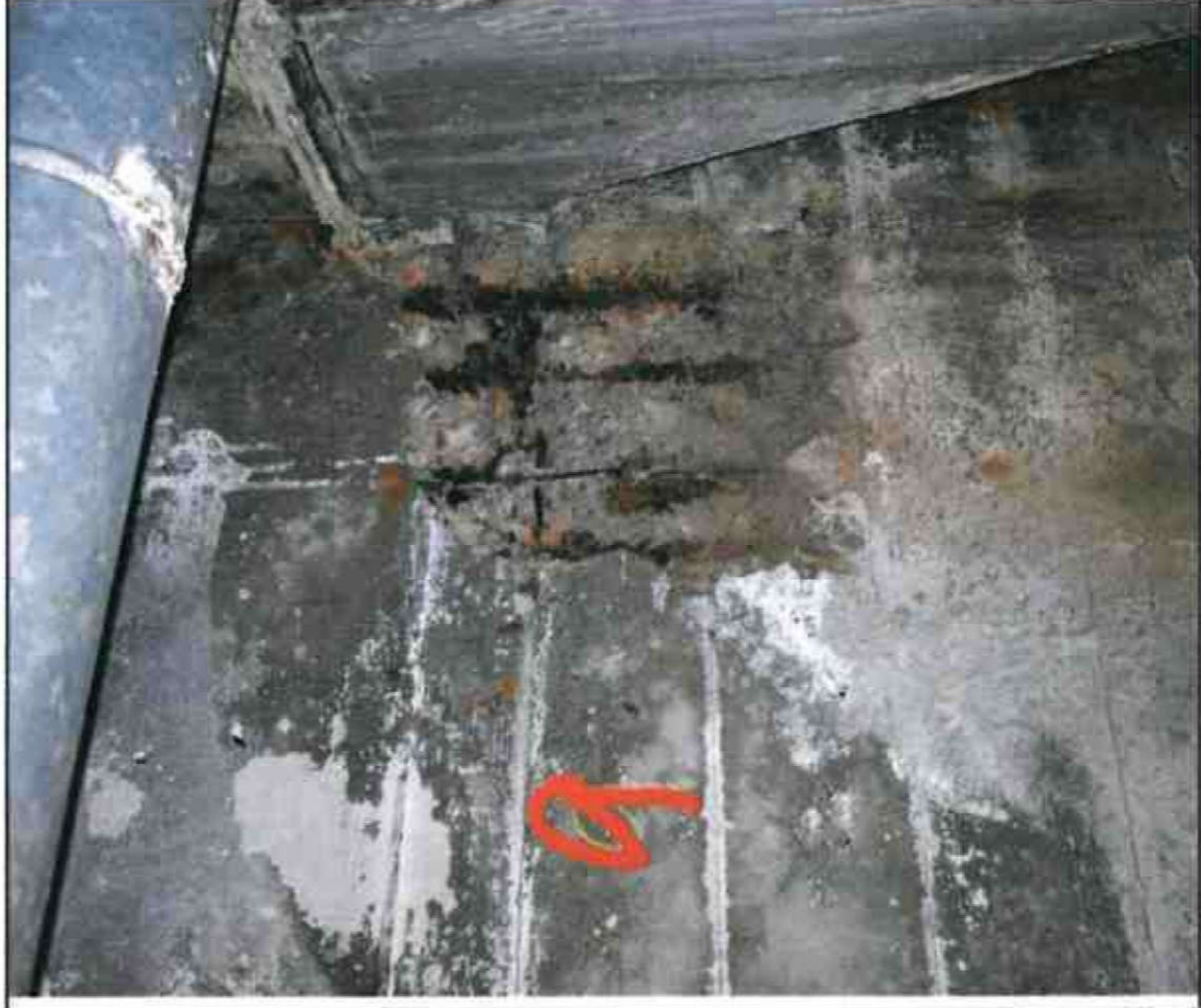
Nr. 9 Außenwand Innenseite