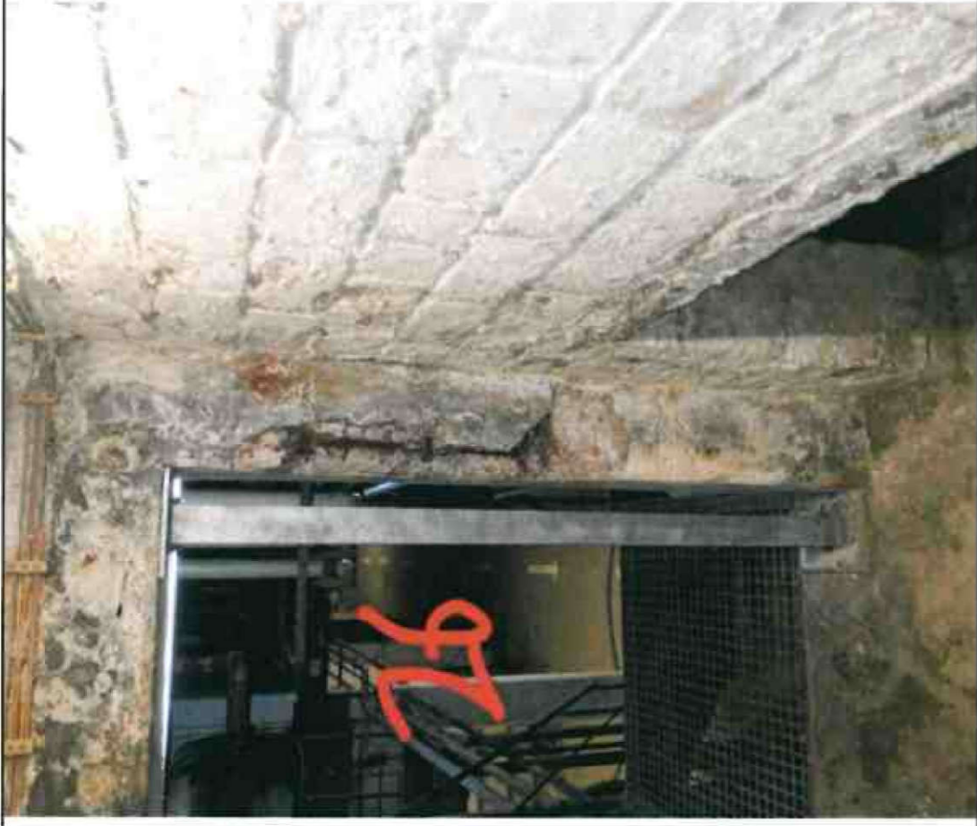
Nr. 26 Türleibung