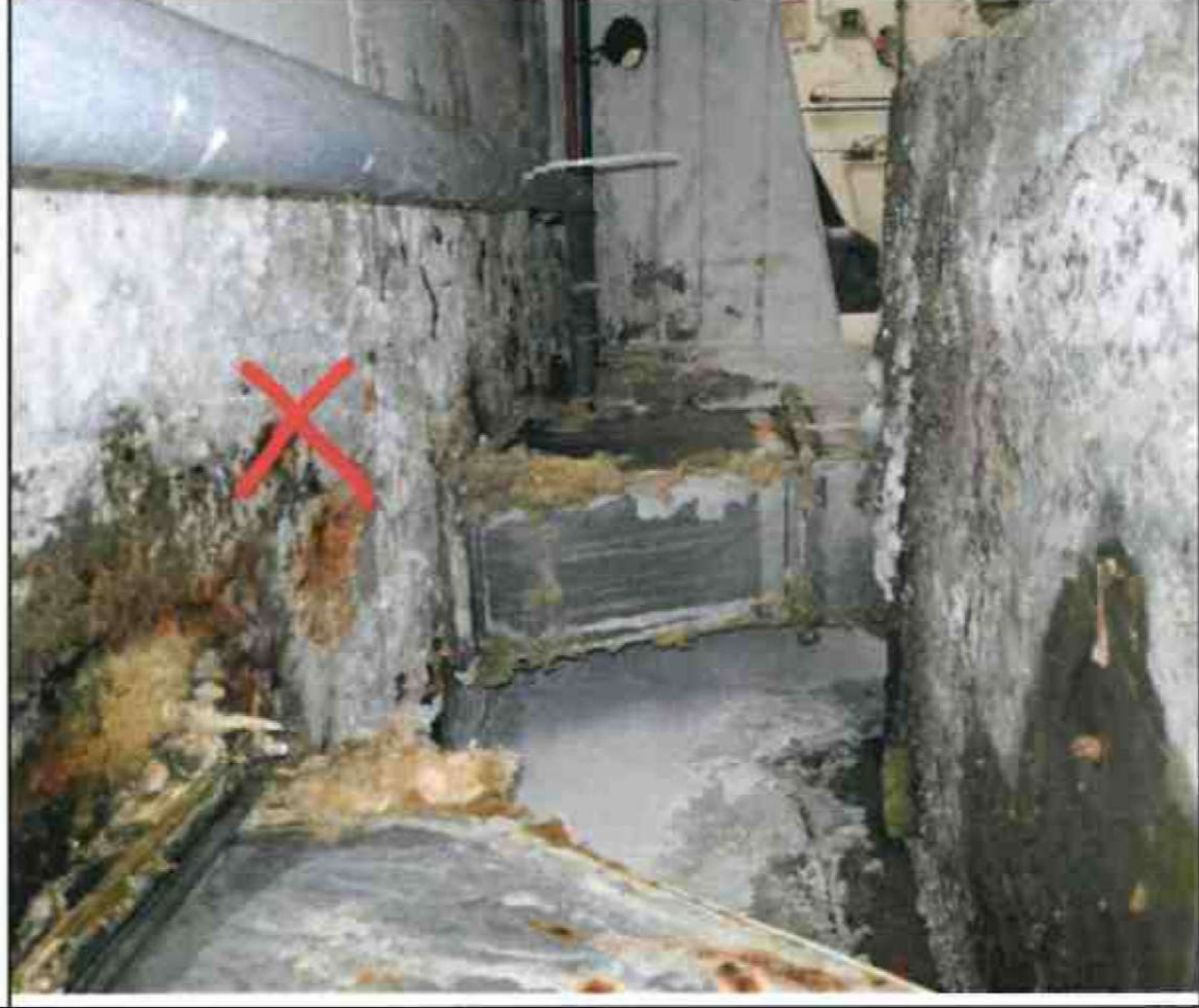
Nr. X Deckendurchbrüche/ Rohrdurchführungen