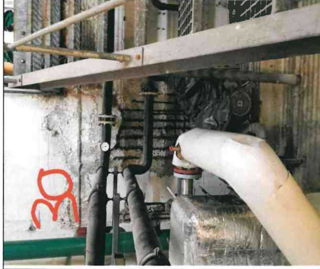
Nr. 30 Innenwand