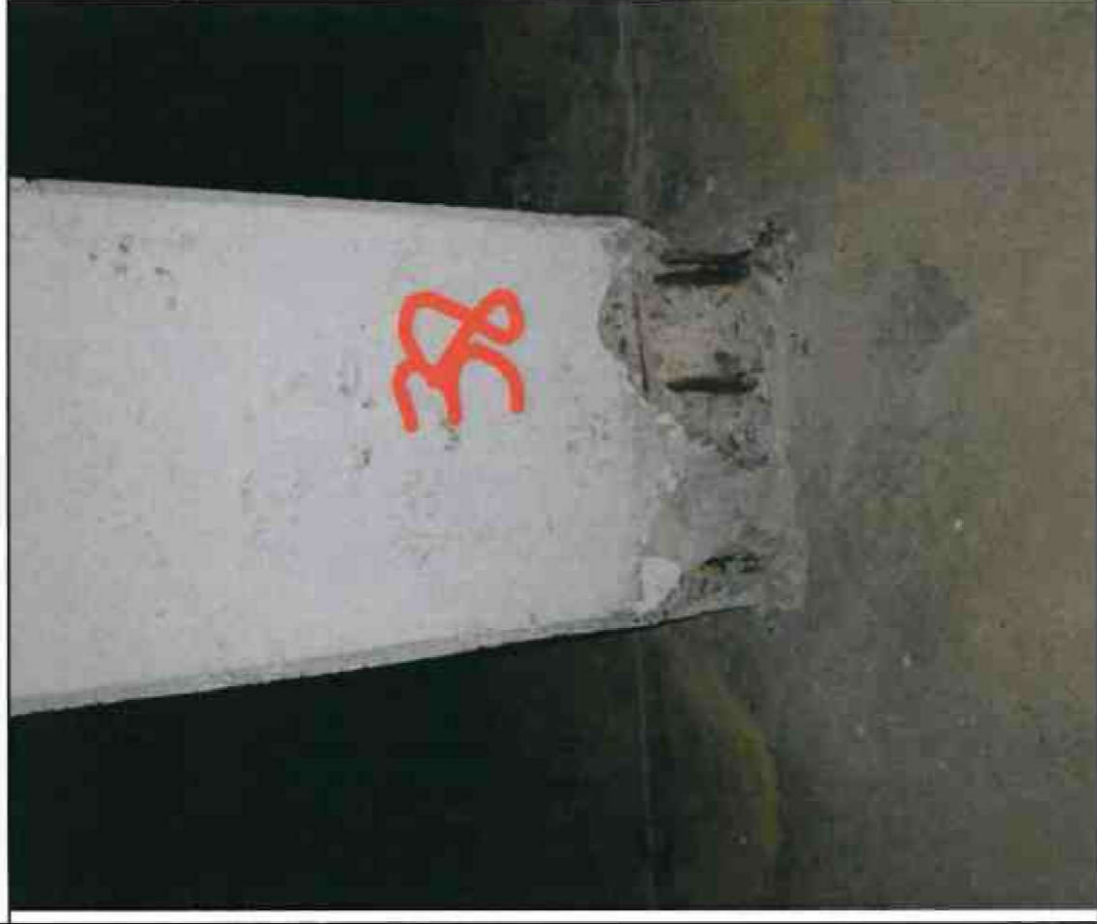
Nr. 38 Stütze