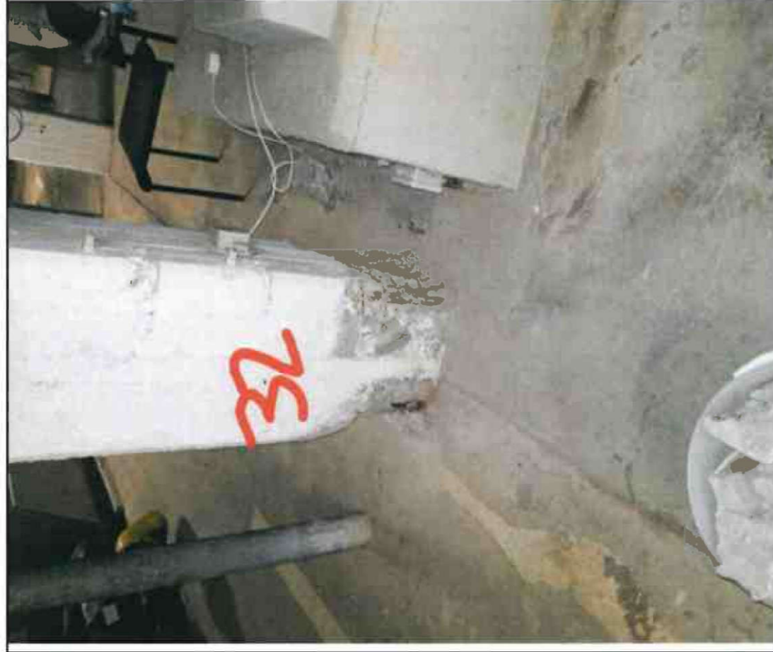
Nr. 32 Stütze