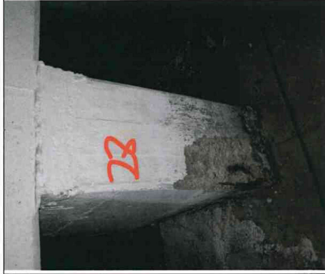
Nr. 28 Stütze