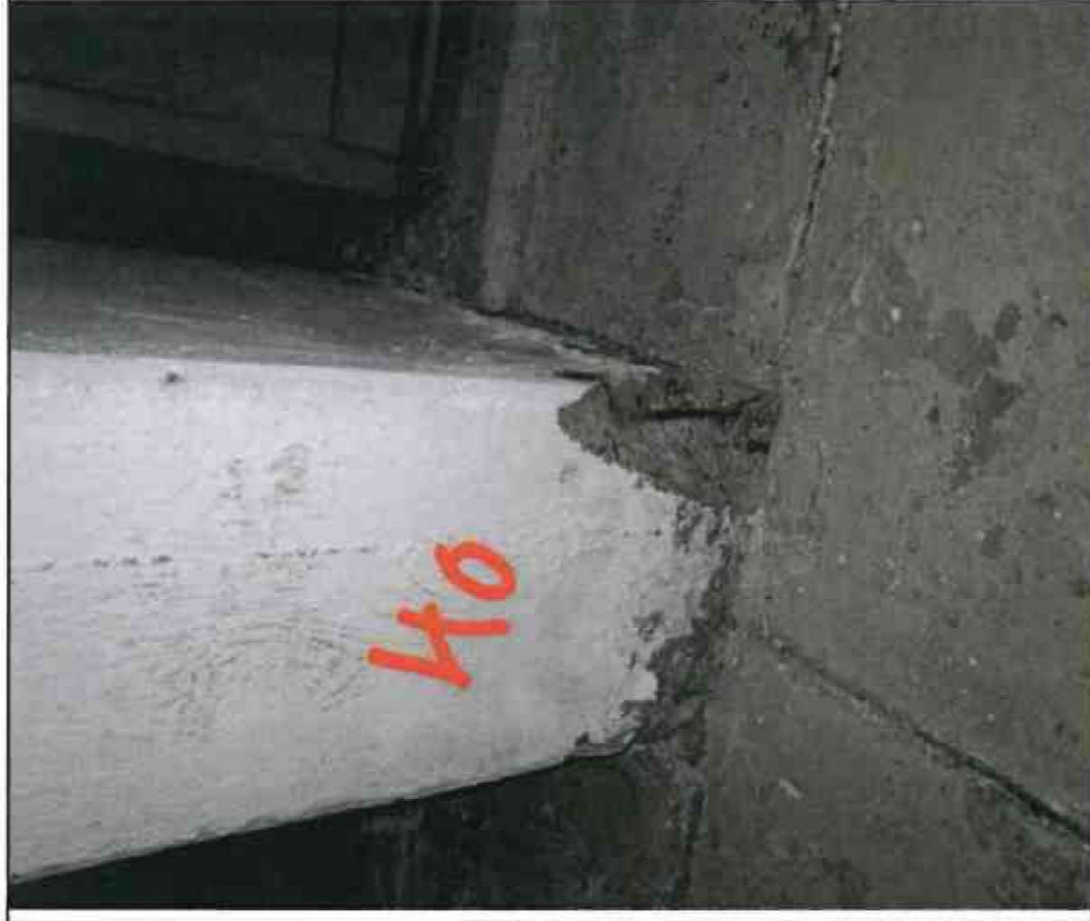
Nr. 40 Stütze