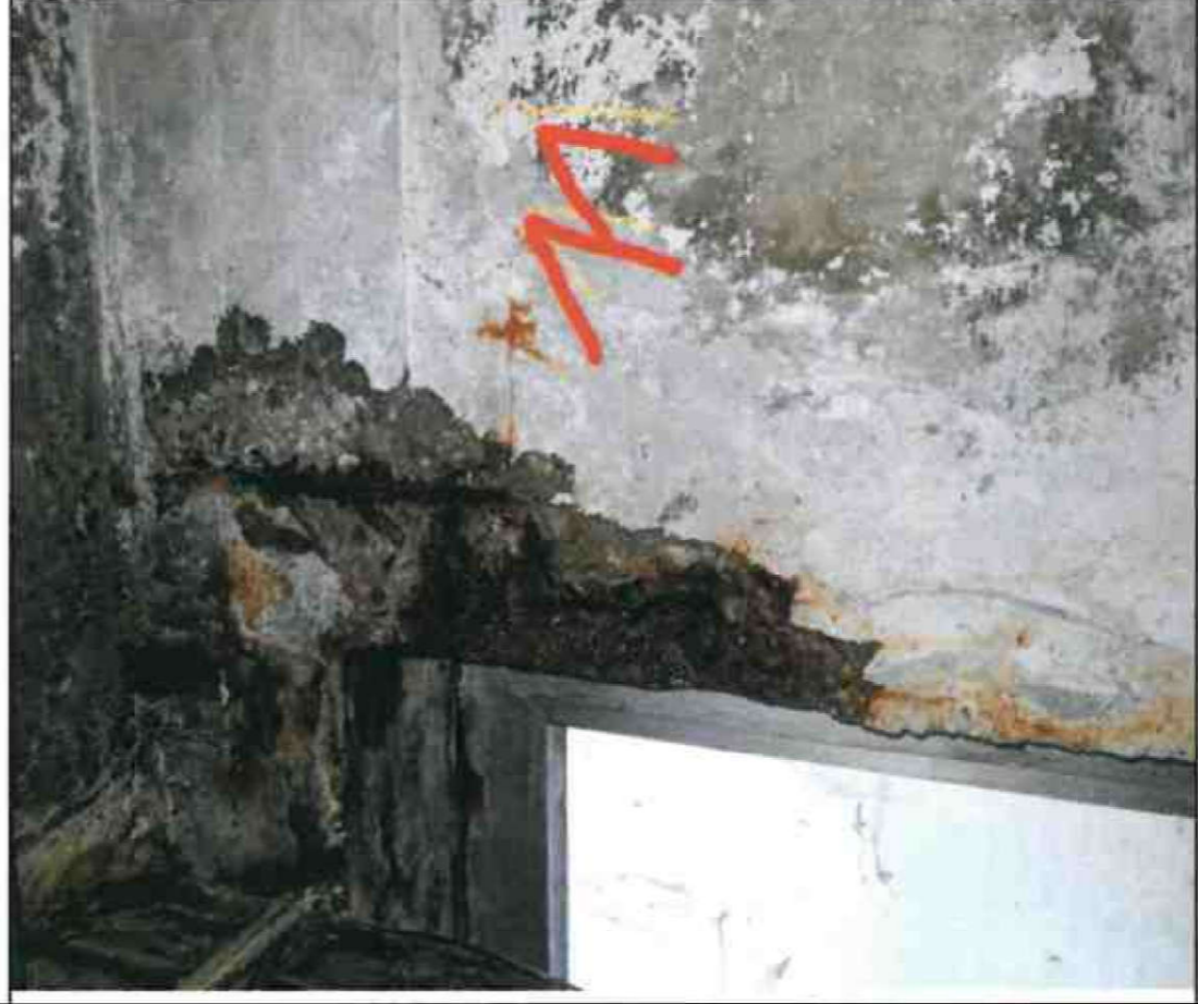
Nr. 11 Fensterleibung