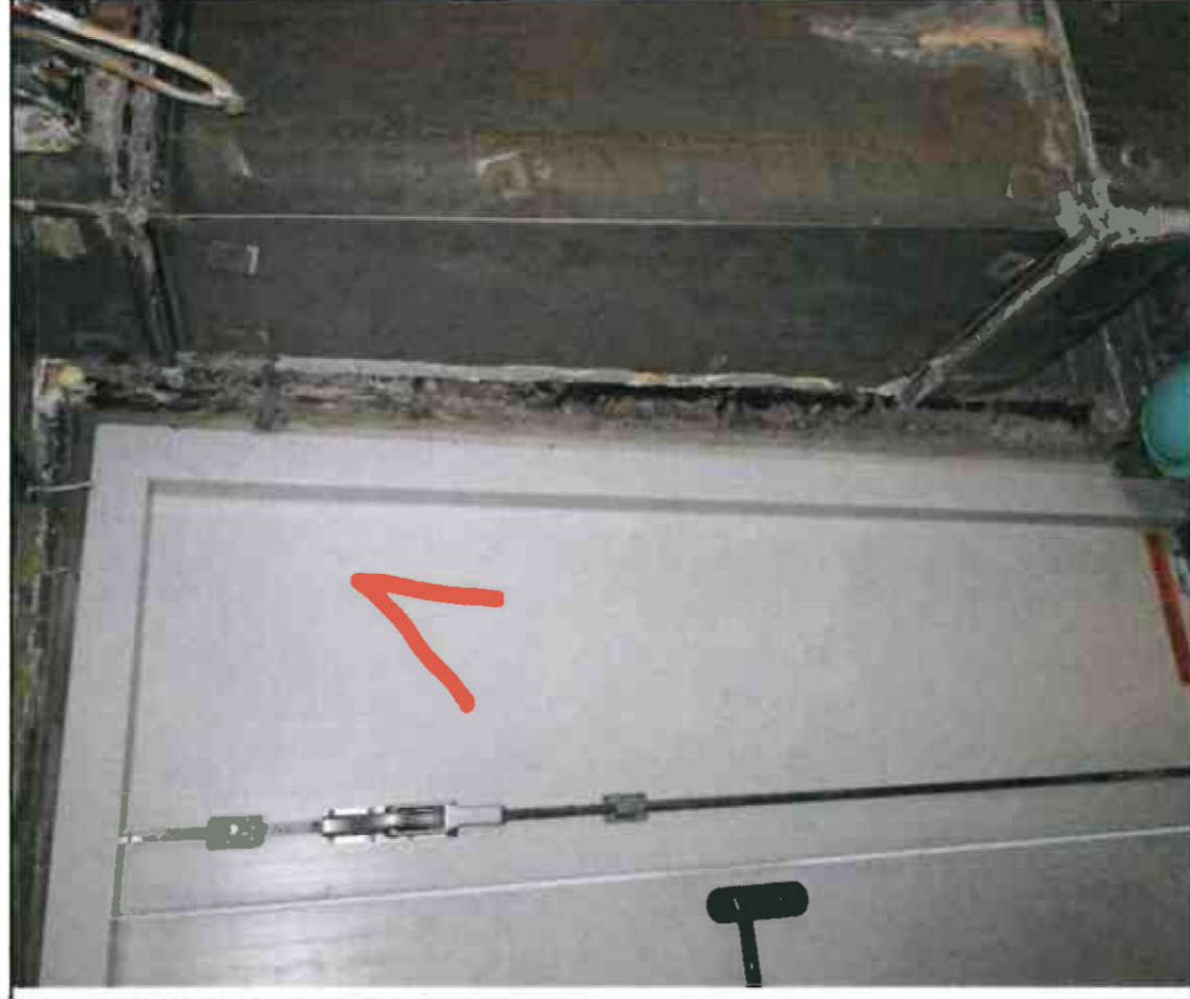
Nr. 1 Türleibung

Protokollierung der Schadstellen 19. April 2023