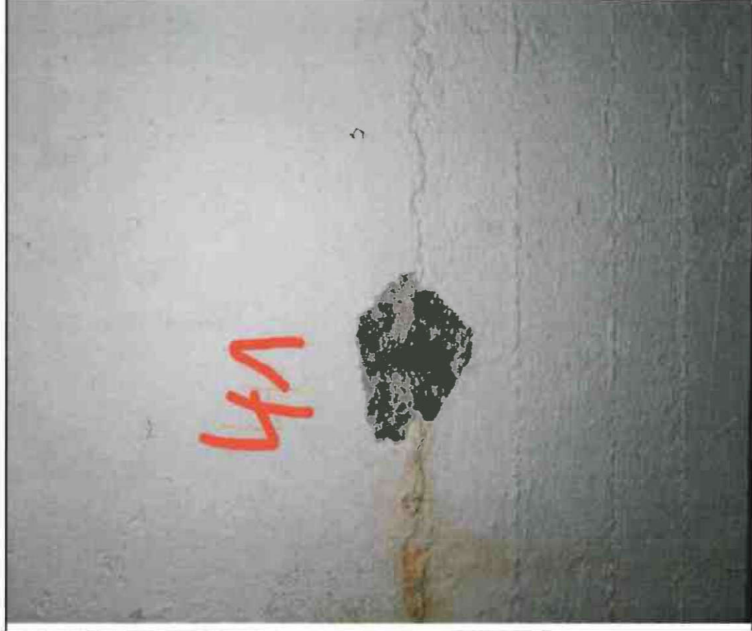
Nr. 41 Innenwand