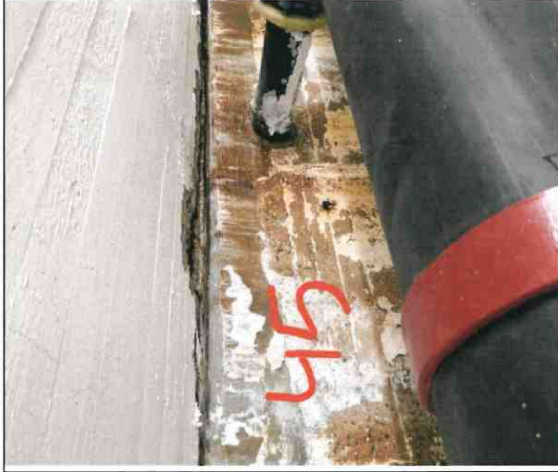
Nr. 45 Sockel/ Decke