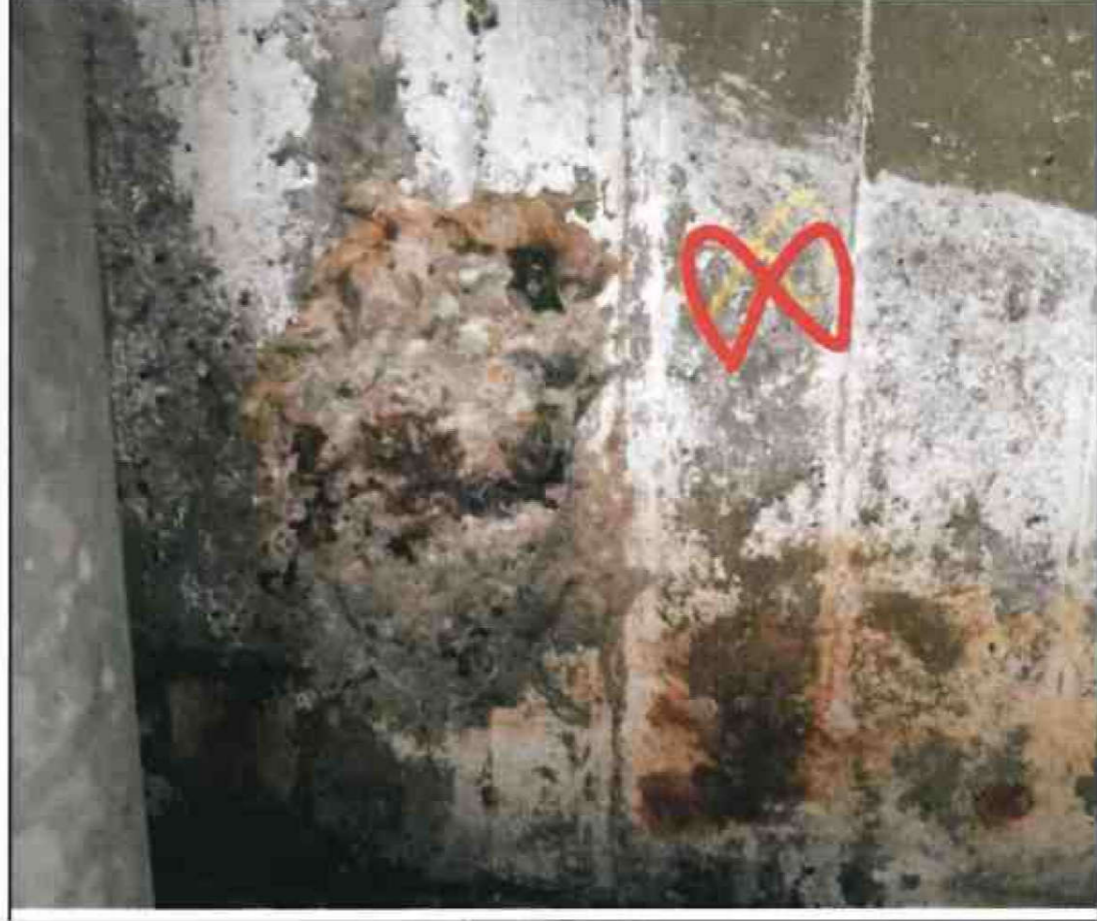
Nr. 8 Außenwand Innenseite