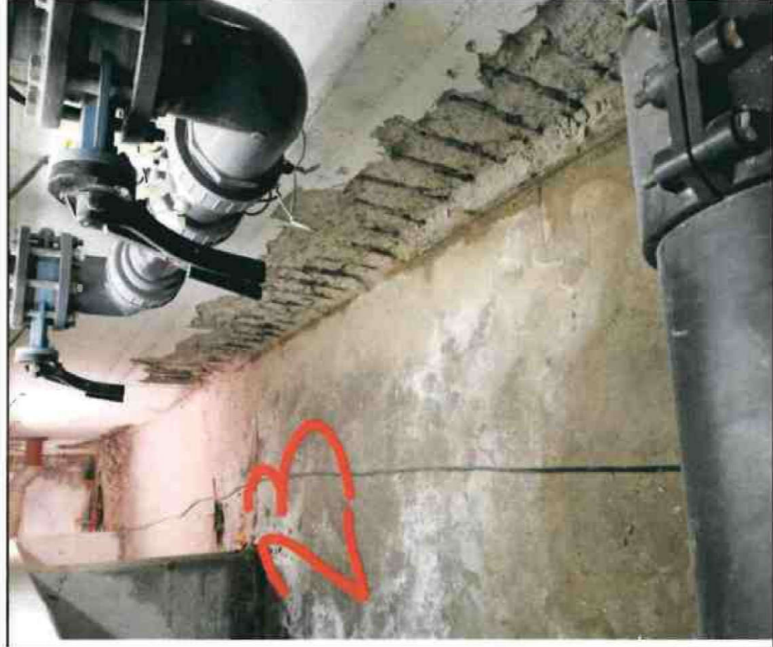
Nr. 23 Wandsohle/ Sockel