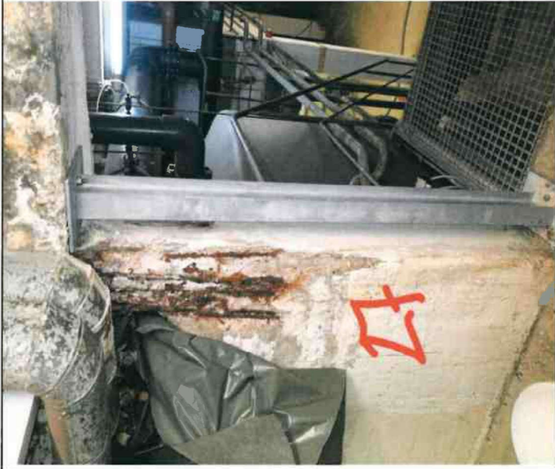
Nr. 27 Türleibung