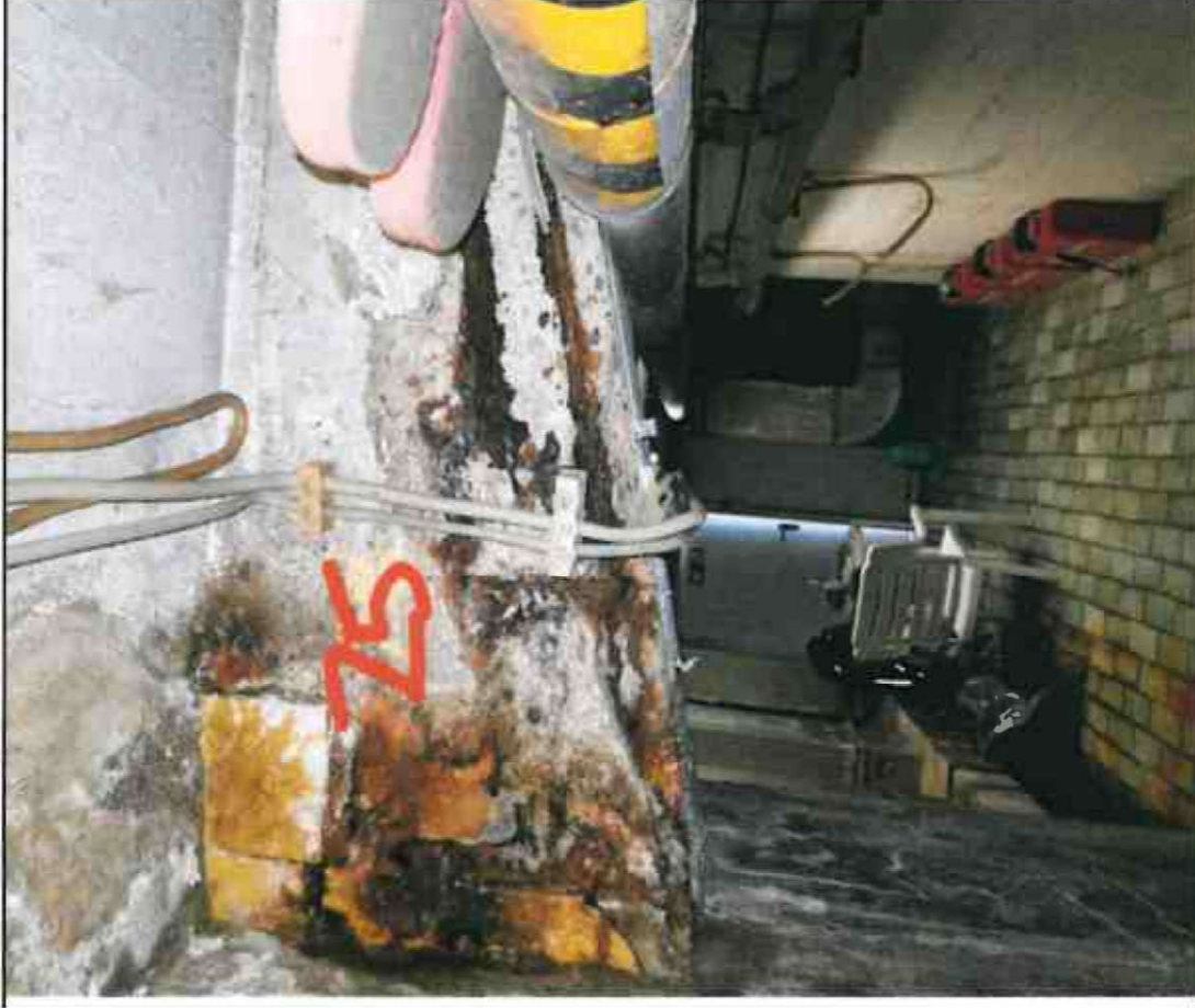
Nr. 25 Stütze/ Decke