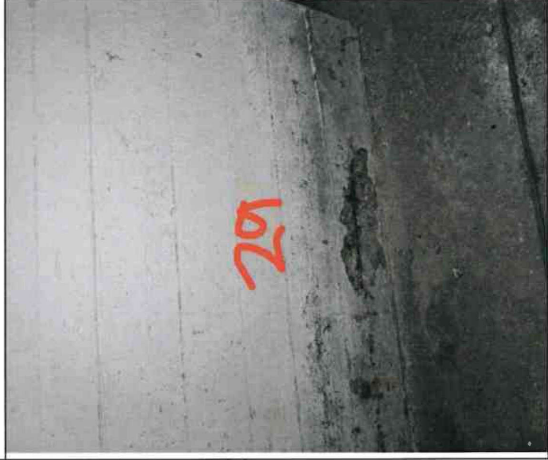
Nr. 29 Wandsohle/ Sockel