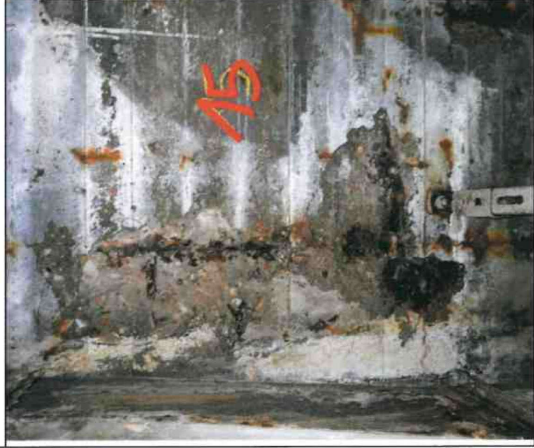
Nr. 15 Außenwand Innenseite