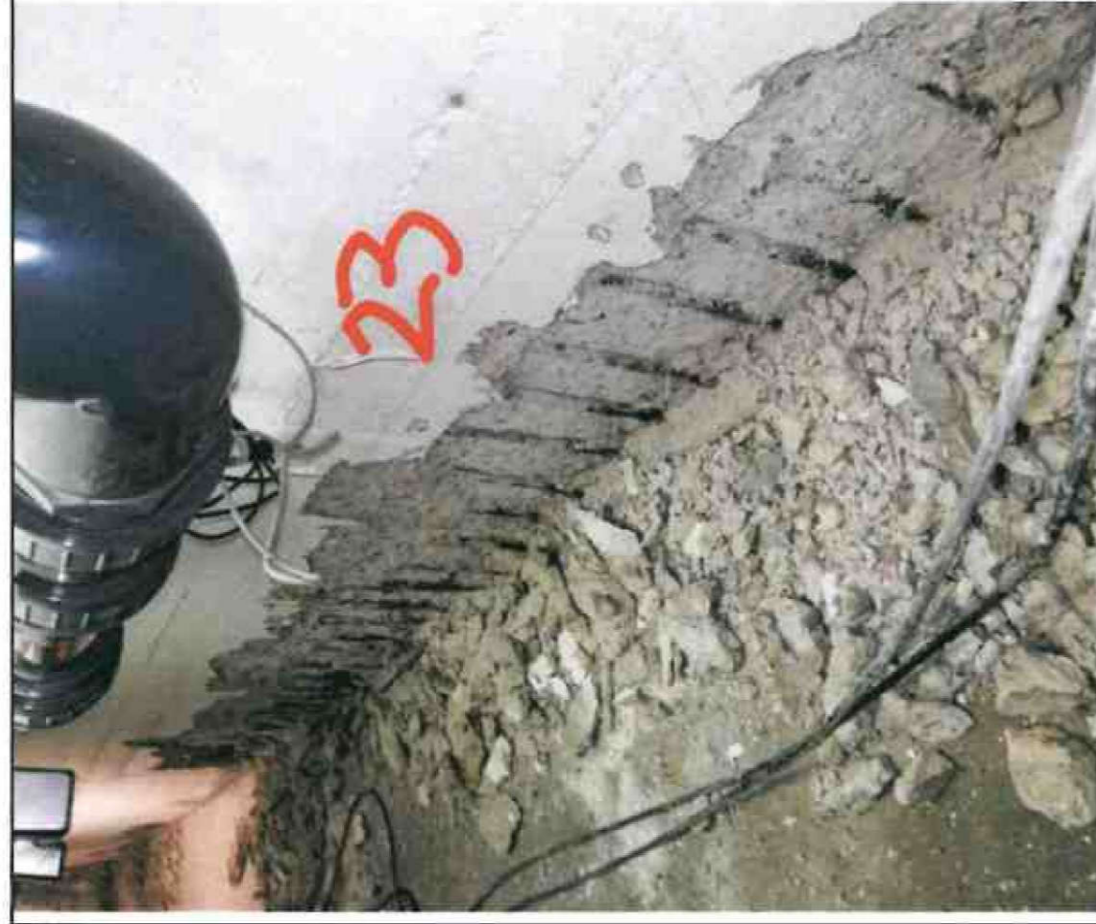
Nr. 23 Wandsohle/ Sockel