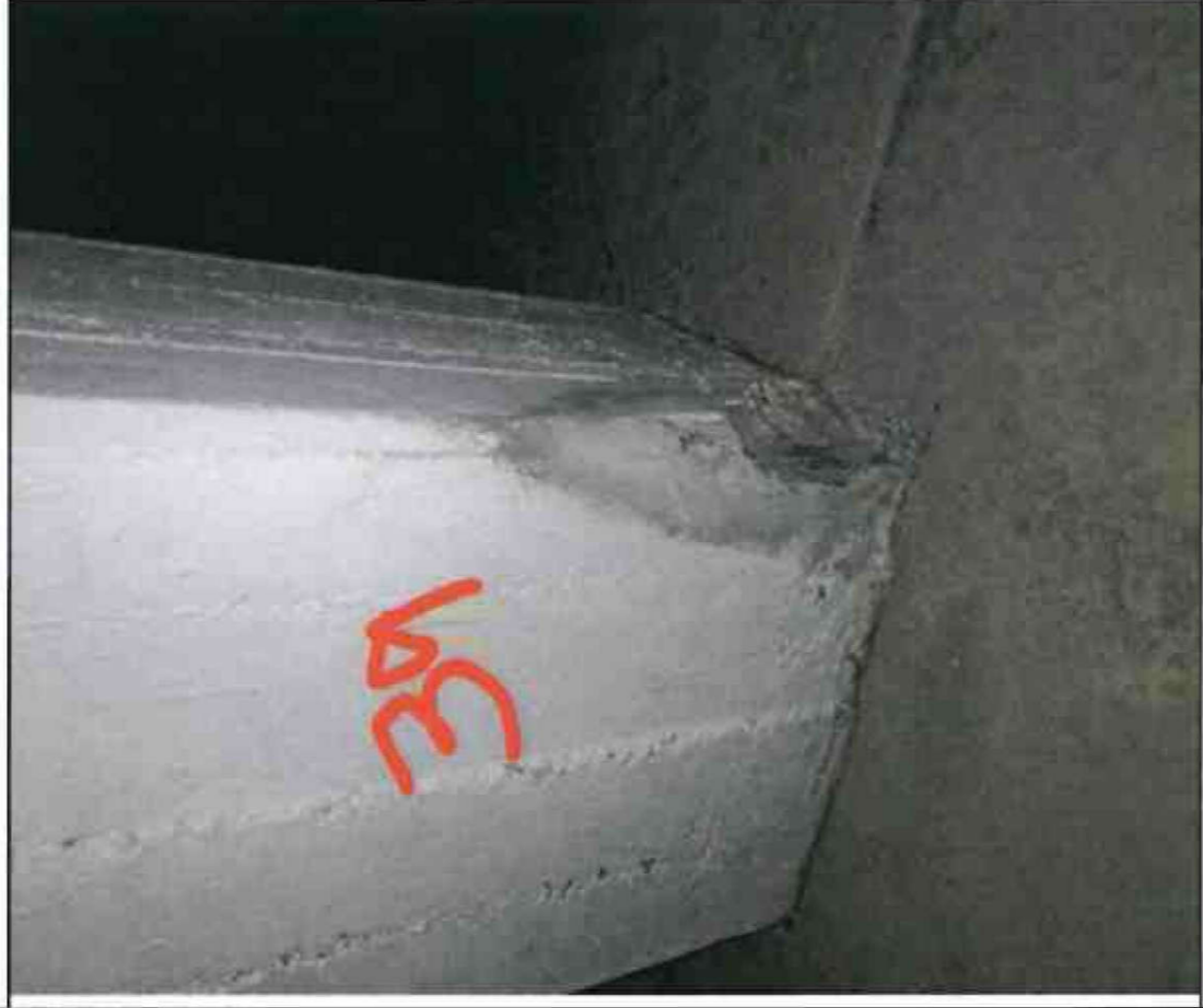
Nr. 39 Stütze