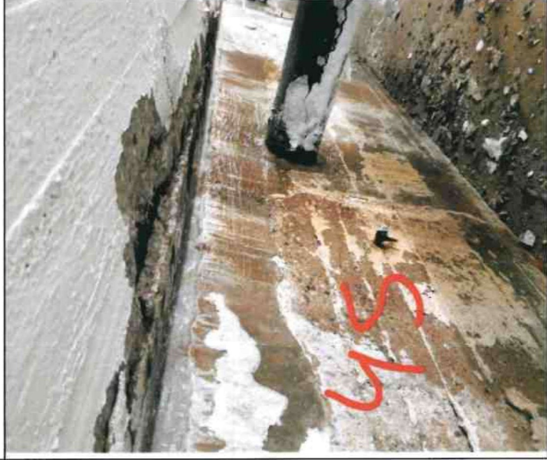
Nr. 45 Sockel/ Decke