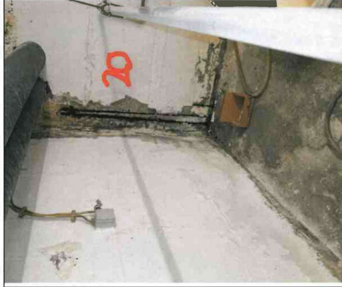
Nr. 20 Außenwand Innenseite (Innenecke)