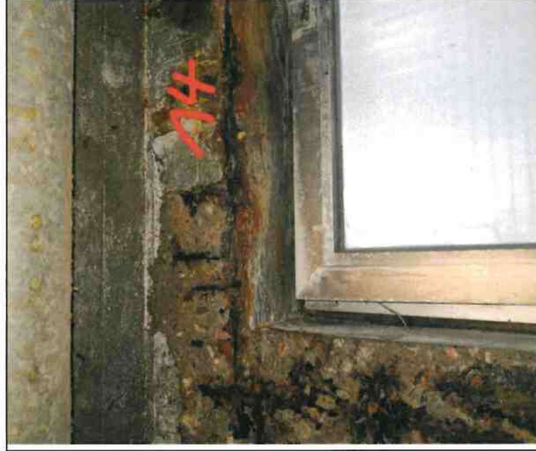
Nr. 14 Fenstersturz