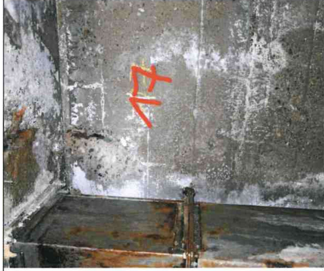
Nr. 17 Außenwand Innenseite