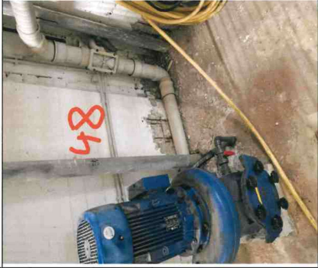
Nr. 48 Wandsohle/ Sockel