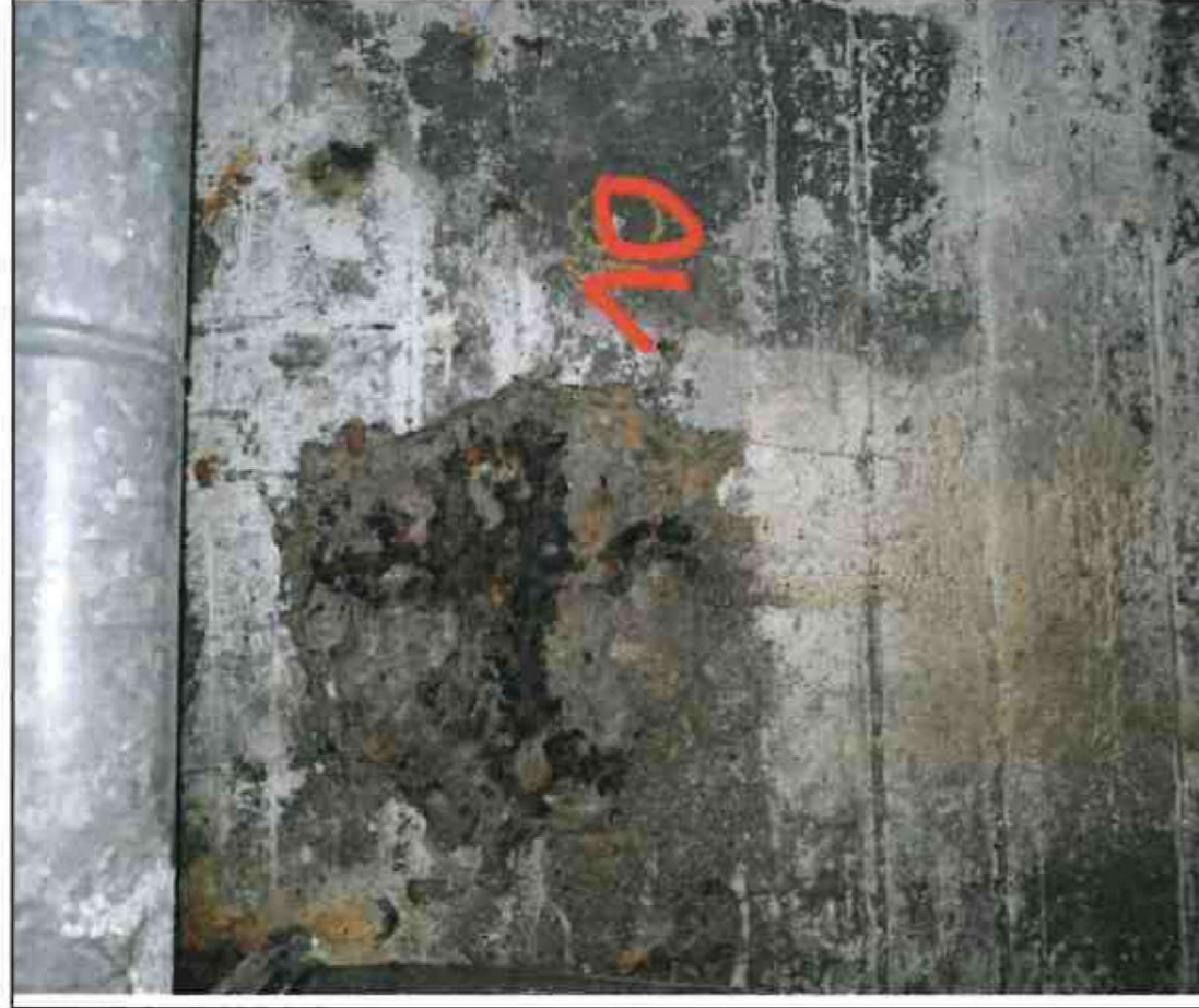
Nr. 10 Außenwand Innenseite