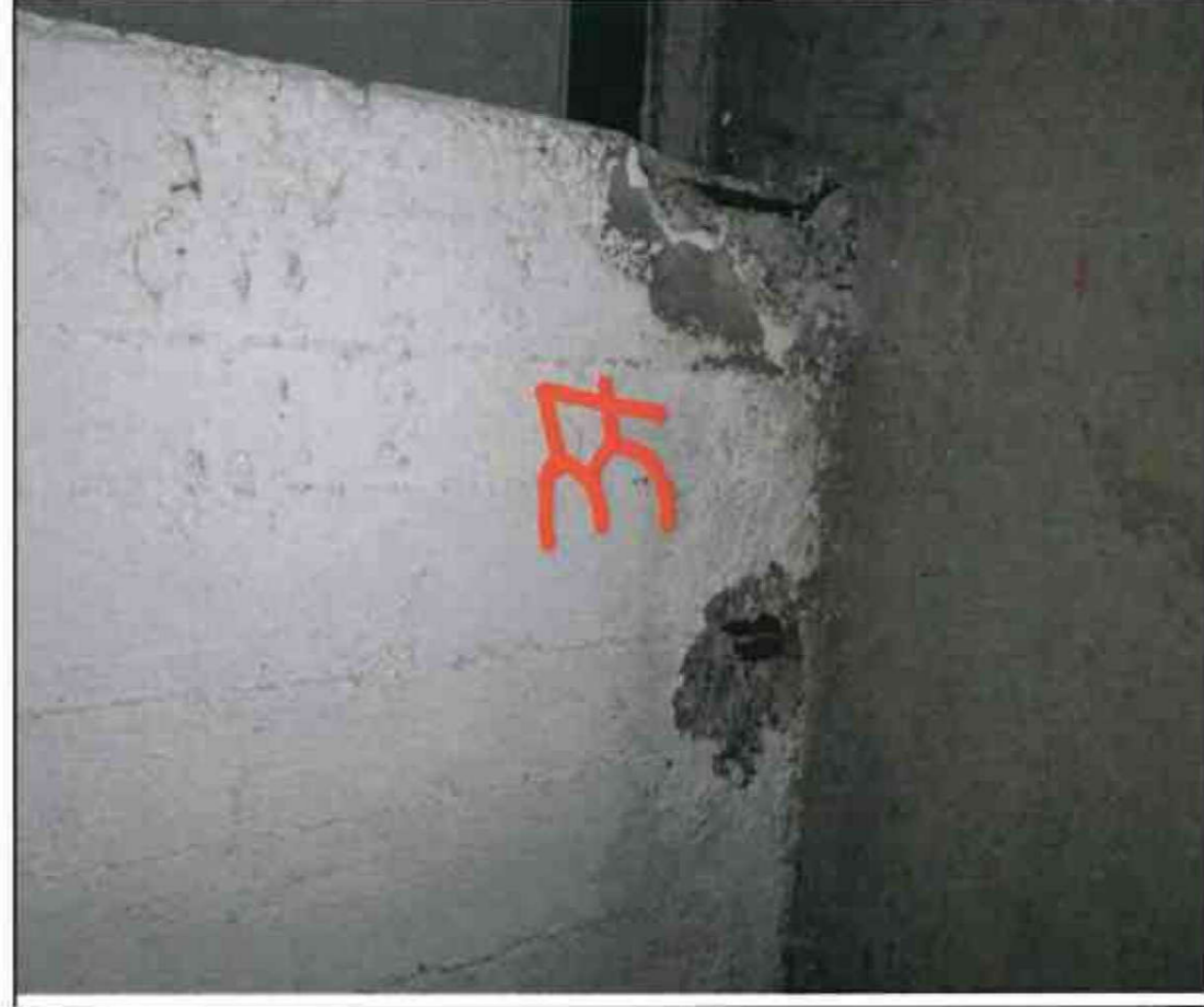
Nr. 37 Stütze