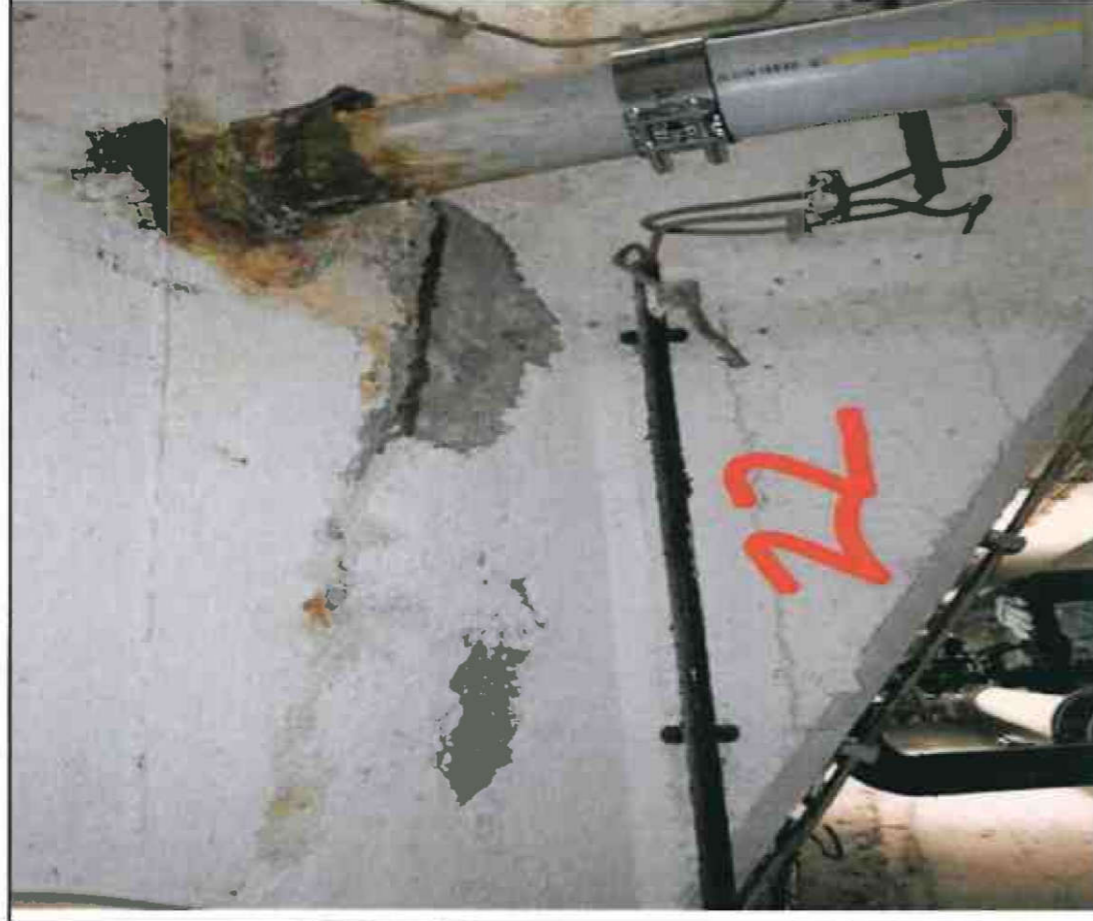
Nr. 22 Stütze/ Decke