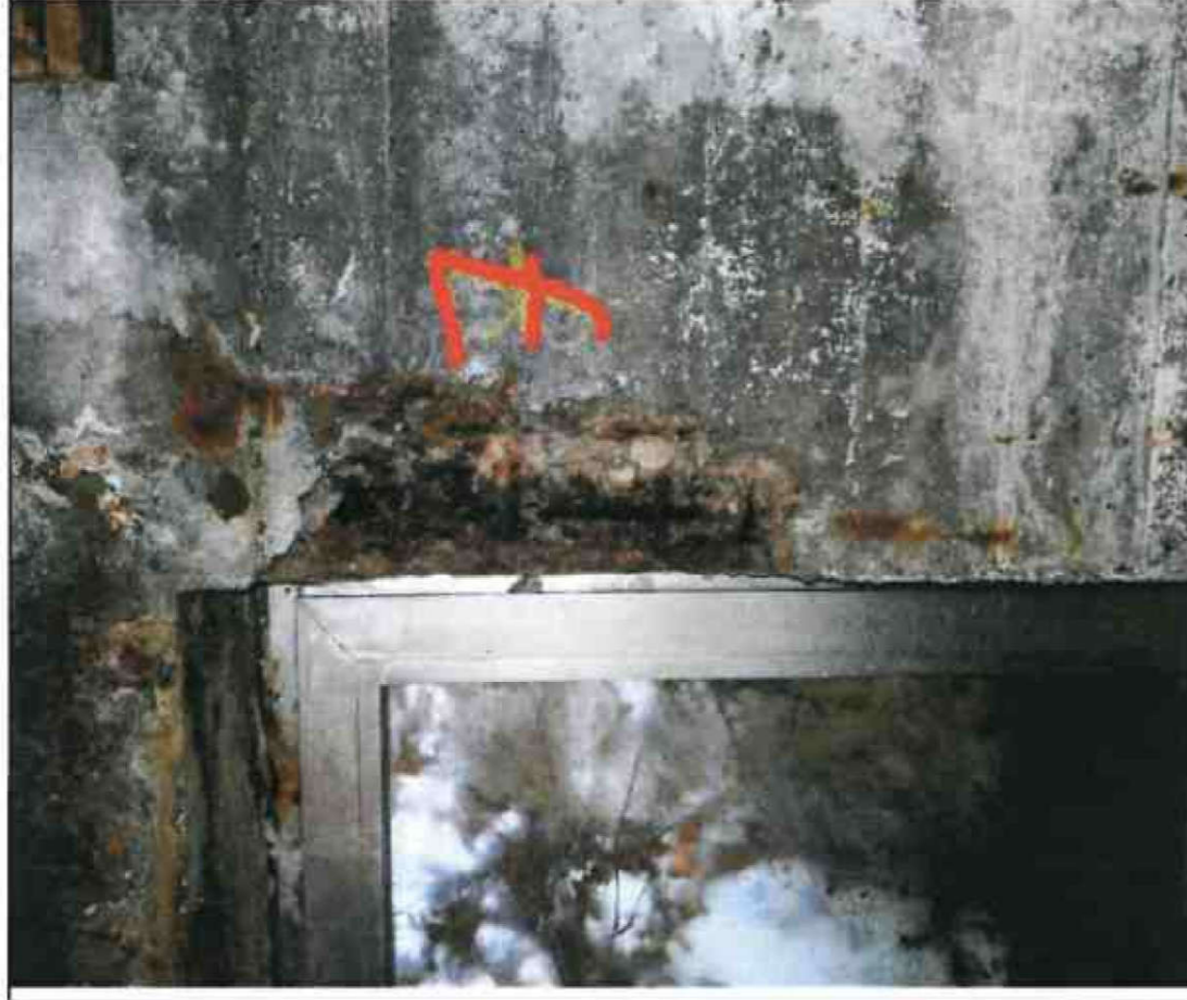
Nr. 7 Fensterleibung