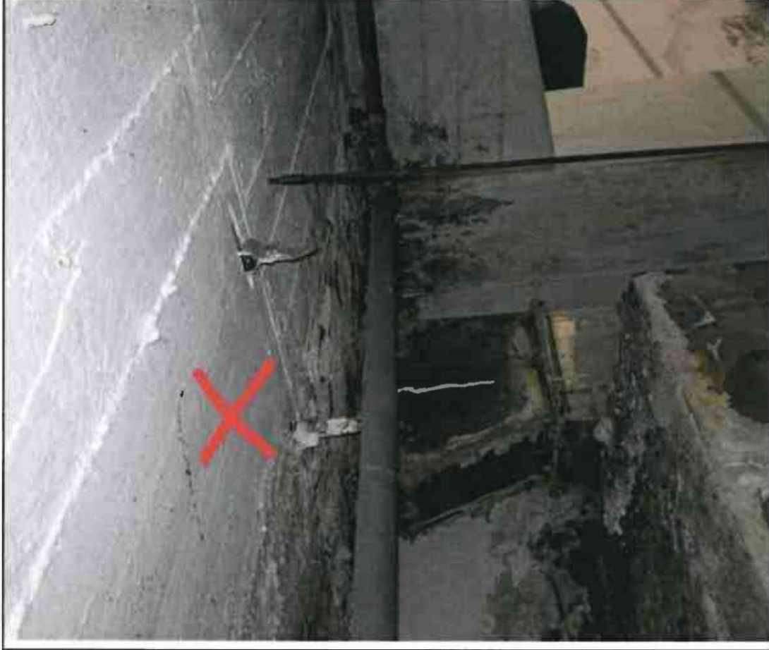
Nr. X Deckendurchbrüche/ Rohrdurchführungen