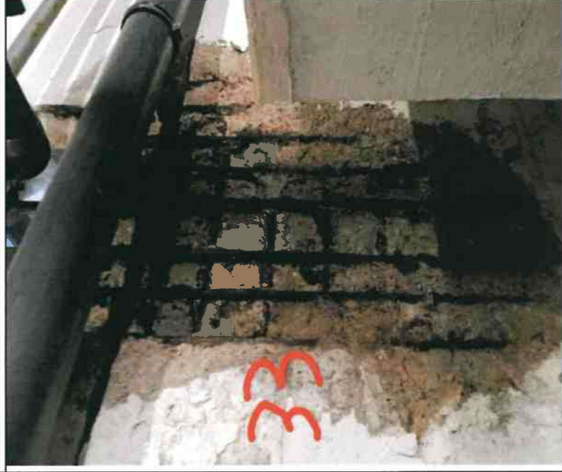
Nr. 33 Innenwand