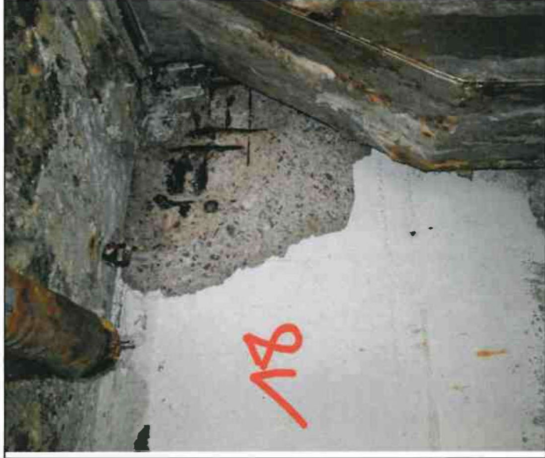
Nr. 18 Außenwand Innenseite