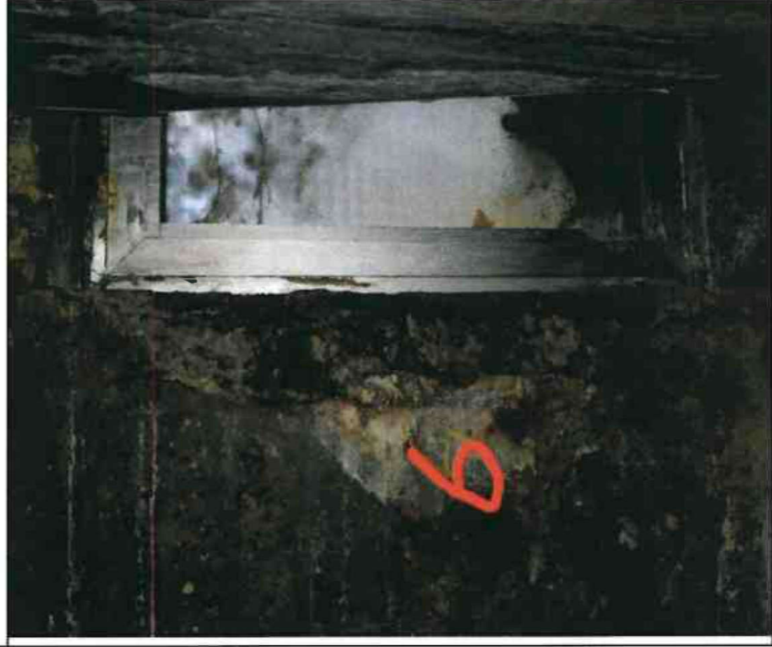
Nr. 6 Fensterleibung