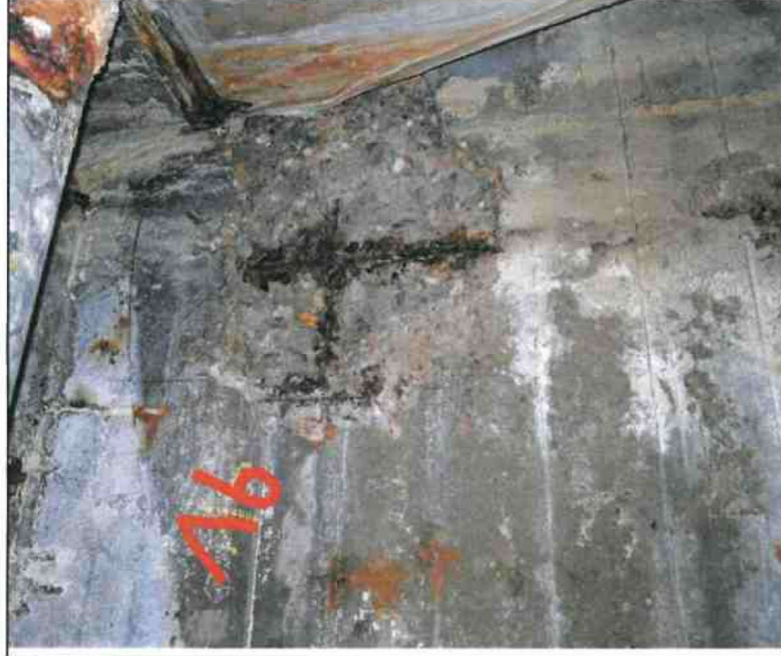
Nr. 16 Außenwand Innenseite