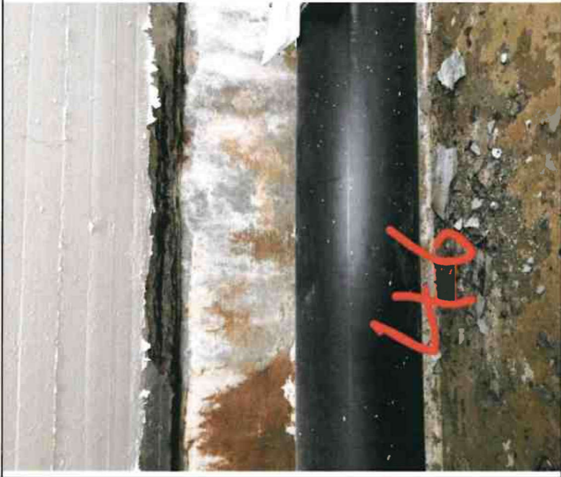
Nr. 46 Sockel/ Decke