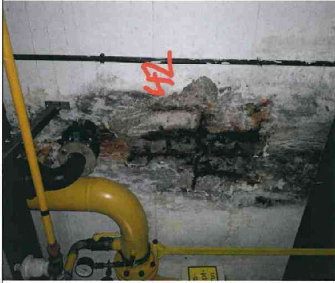
Nr. 42 Innenwand