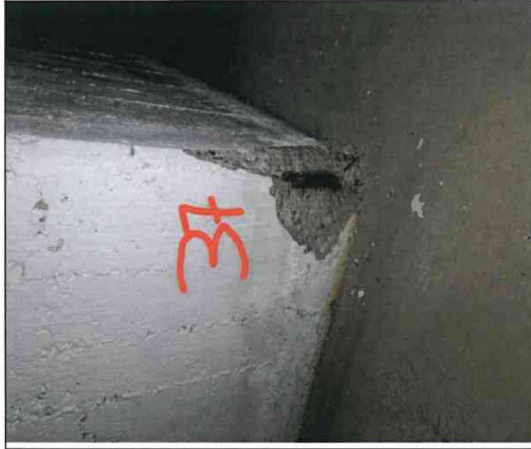
Nr. 37 Stütze