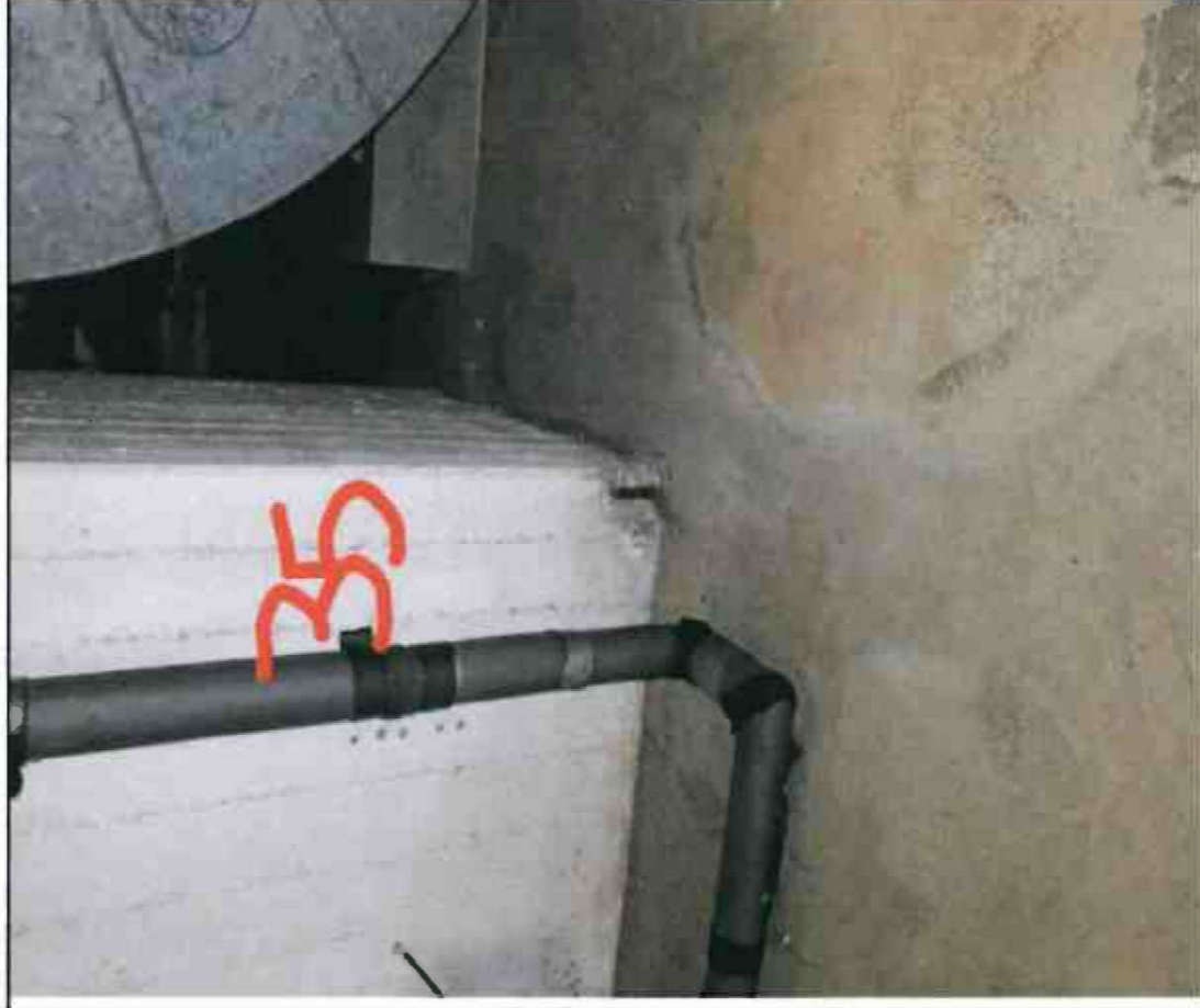
Nr. 35 Stütze