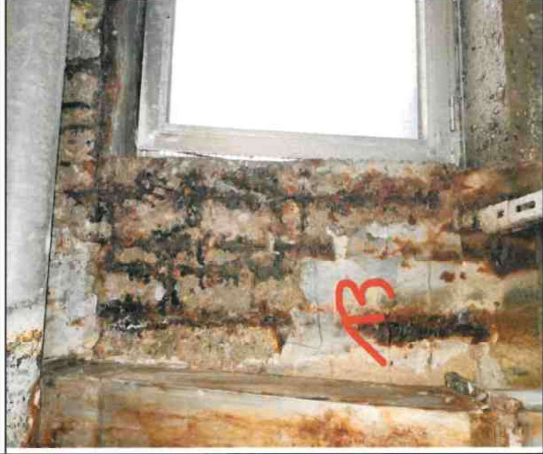
Nr. 13 Außenwand Innenseite