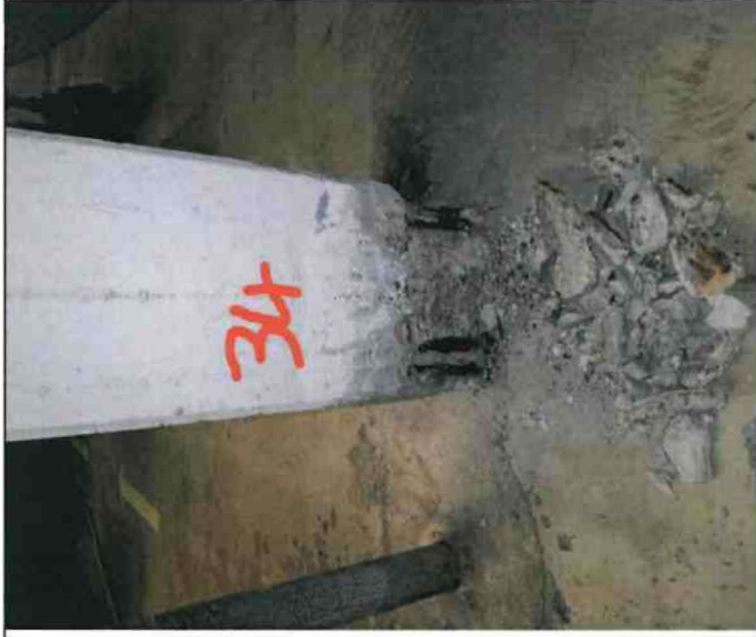
Nr. 34 Stütze