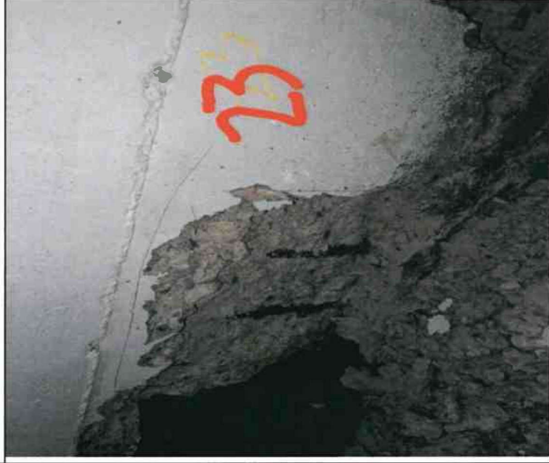
Nr. 23 Wandsohle/ Sockel