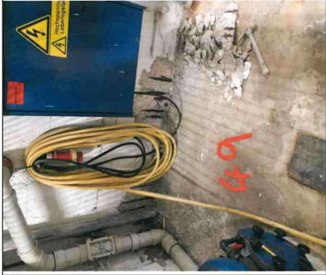
Nr. 49 Wandsohle/ Sockel