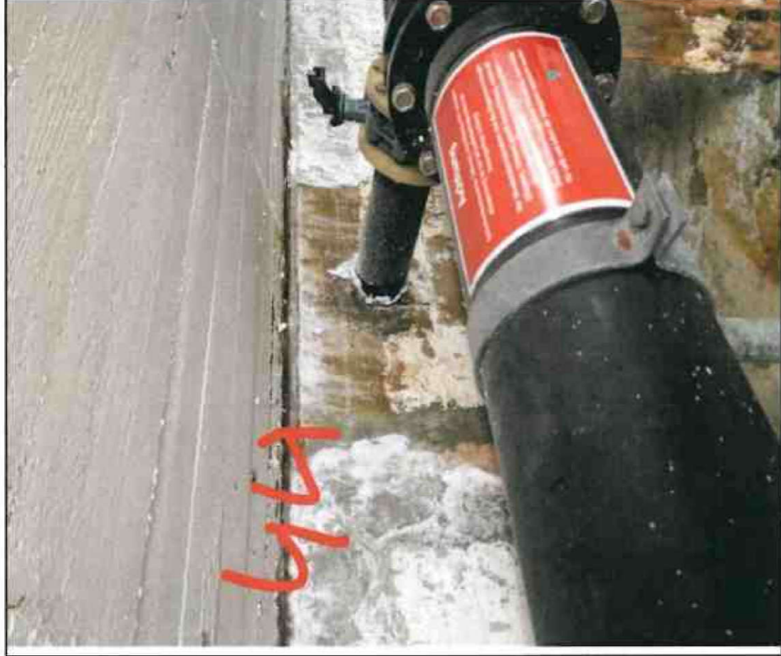
Nr. 44 Sockel/ Decke