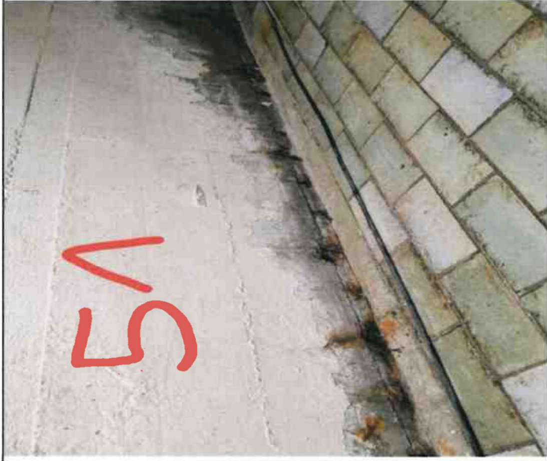
Nr. 51 Wandsohle/ Sockel