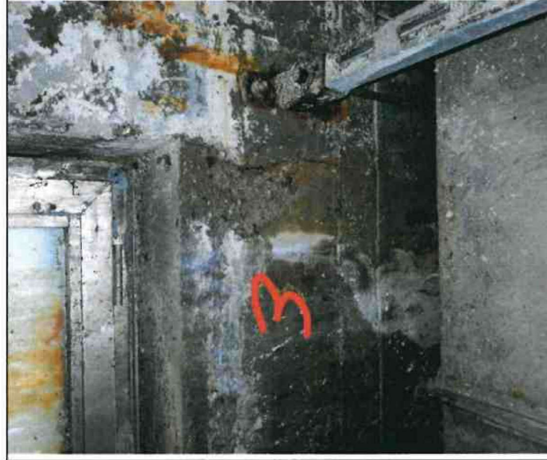
Nr. 3 Außenwand Innenseite