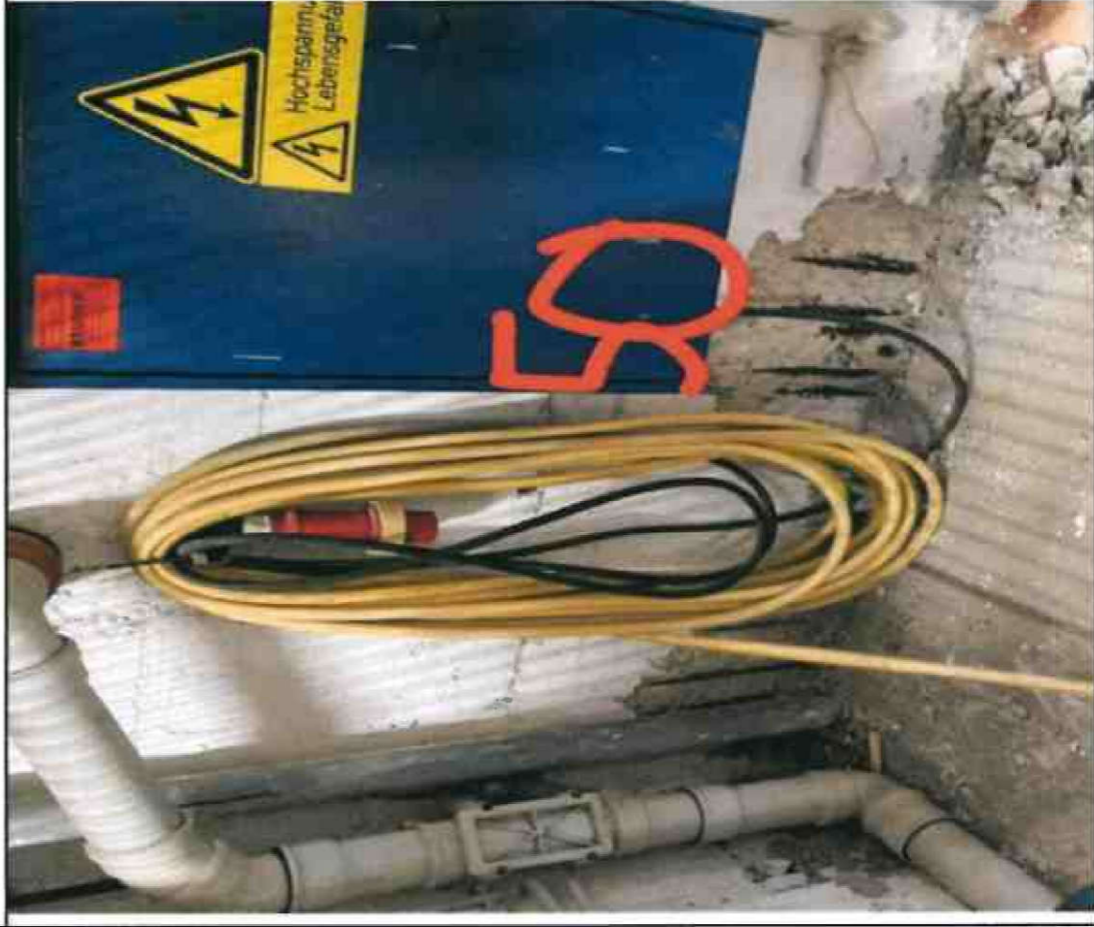
Nr. 50 Wandsohle/ Sockel