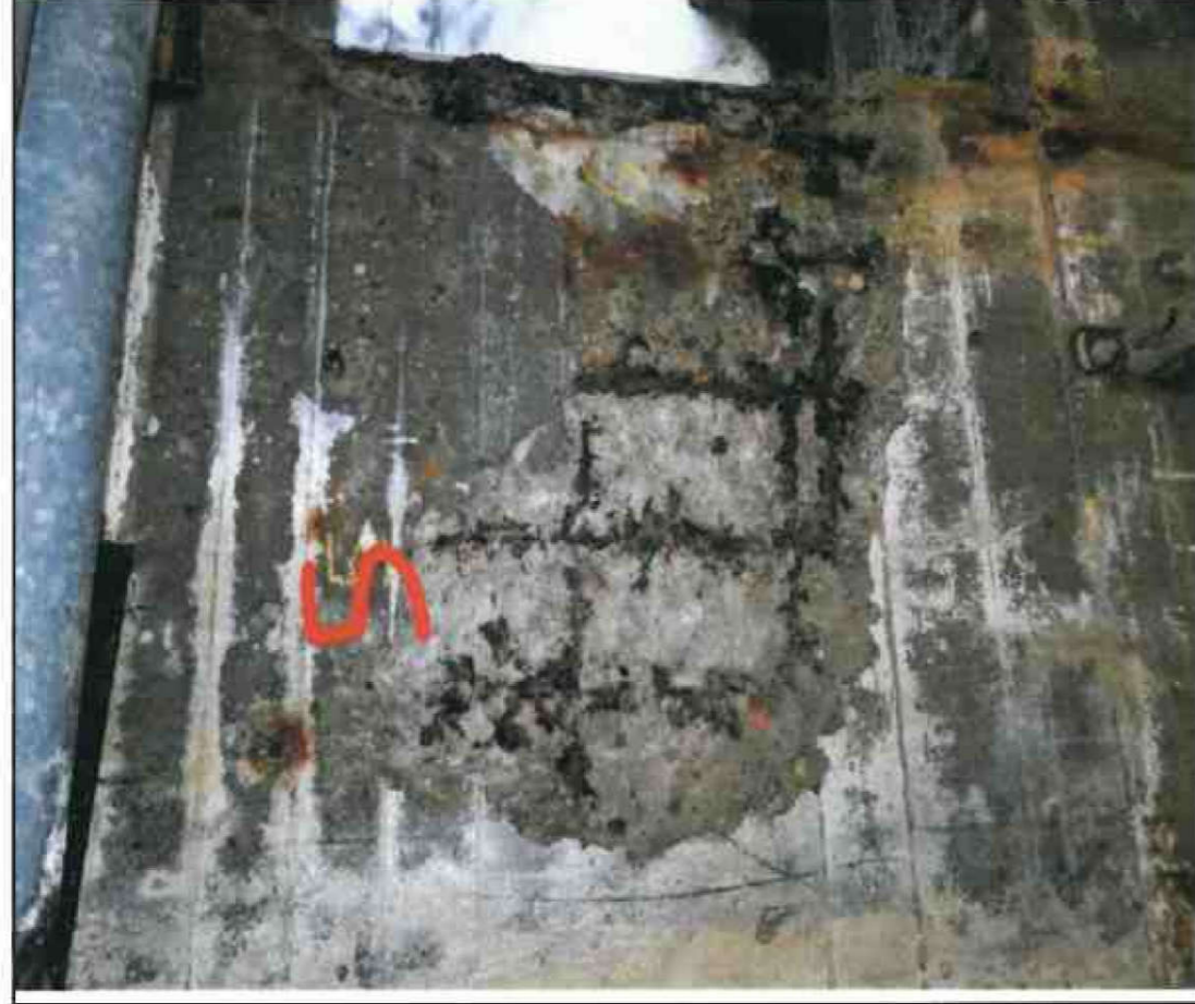
Nr. 5 Außenwand Innenseite