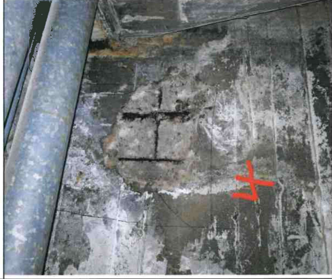
Nr. 4 Außenwand Innenseite