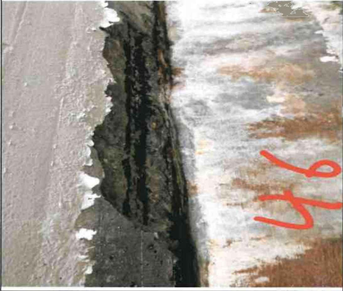
Nr. 46 Sockel/ Decke