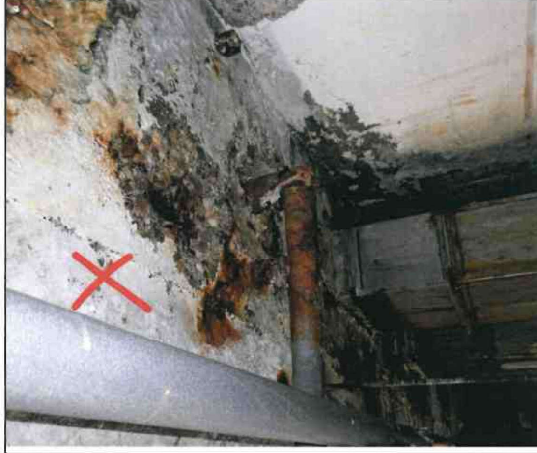
Nr. X Deckendurchbrüche/ Rohrdurchführungen