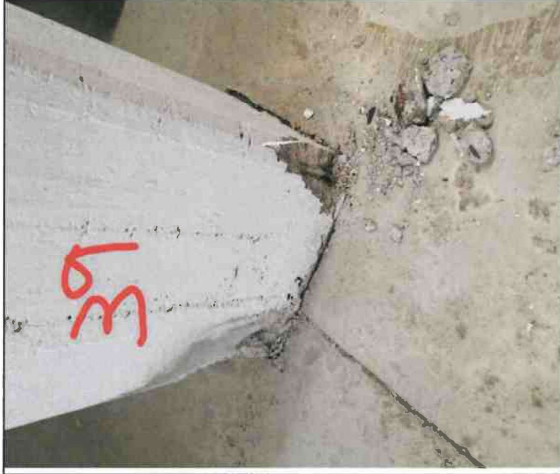
Nr. 39 Stütze