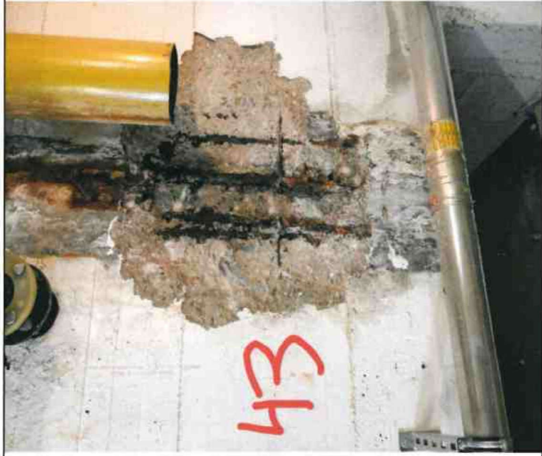
Nr. 43 Innenwand