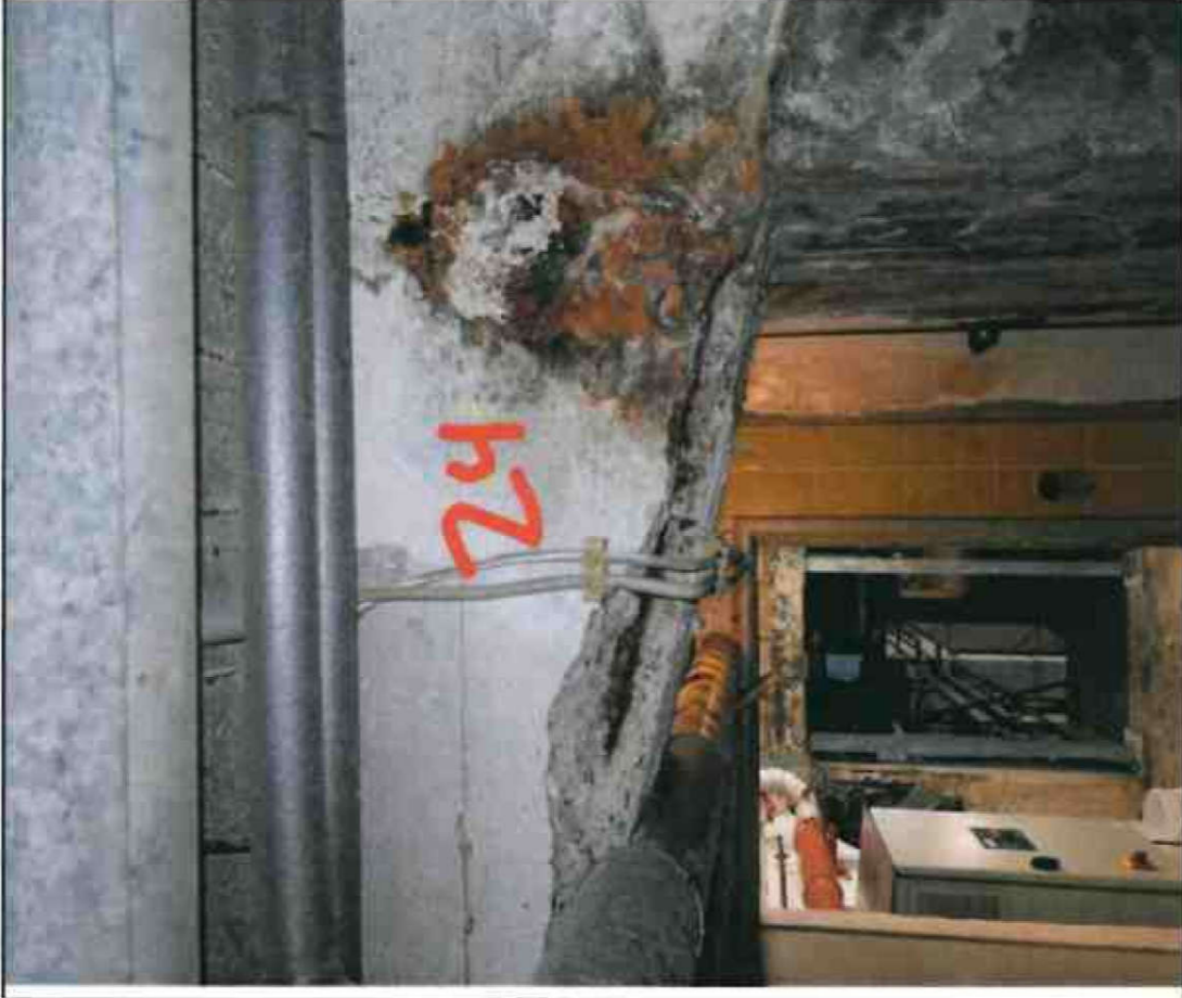
Nr. 24 Stütze/ Decke