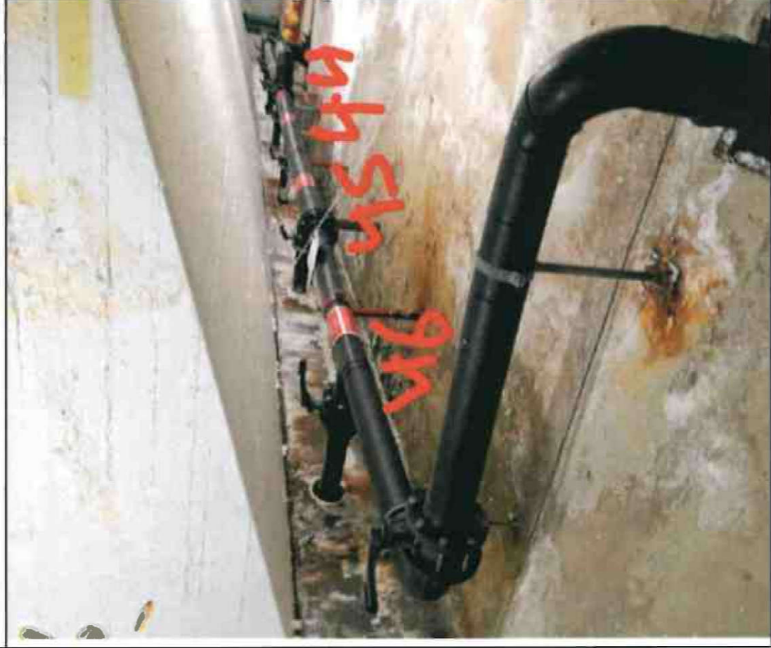
Nr. 44, 45, 46 Sockel/ Decke