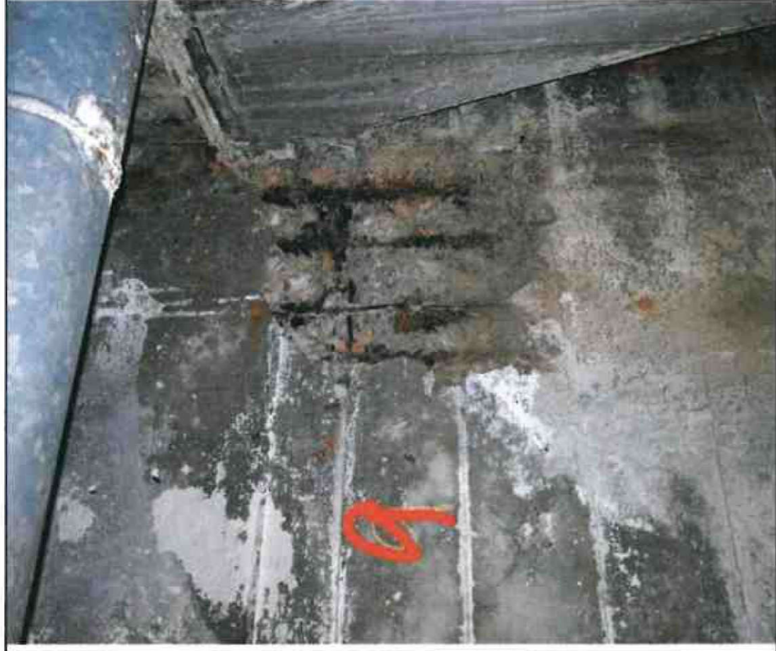
Nr. 9 Außenwand Innenseite