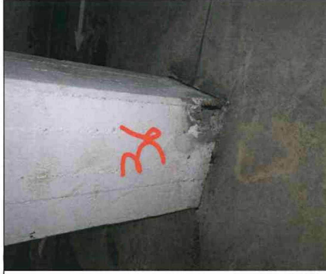
Nr. 36 Stütze