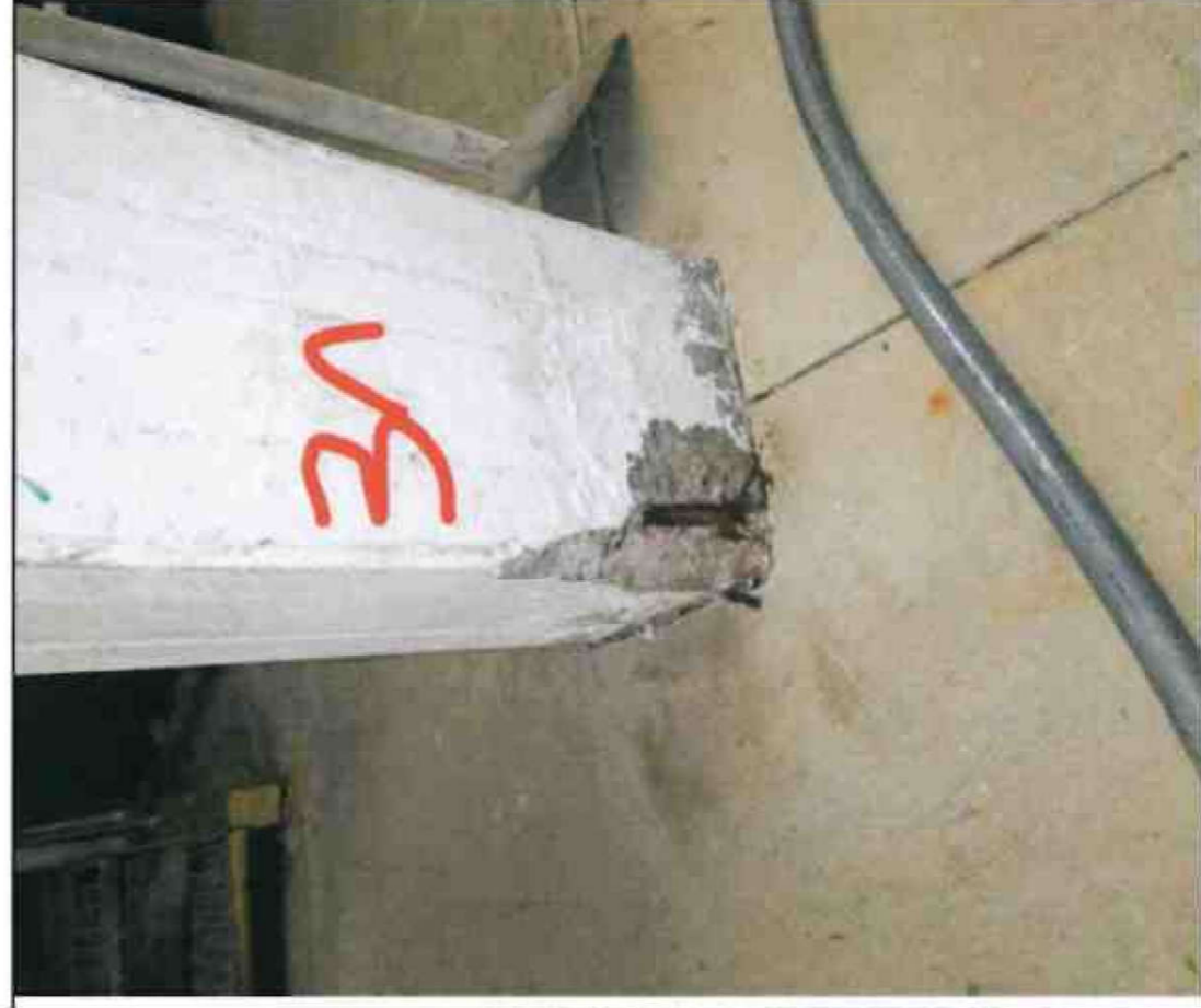
Nr. 31 Stütze