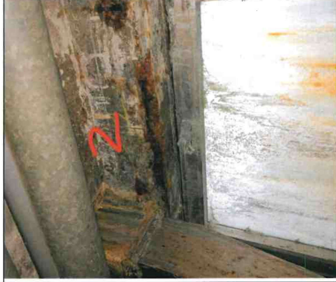
Nr. 2 Fenstersturz