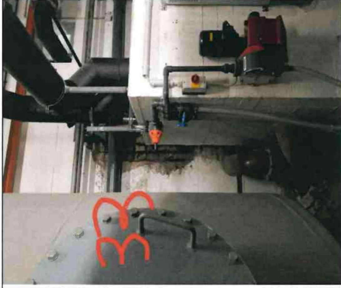
Nr. 33 Innenwand