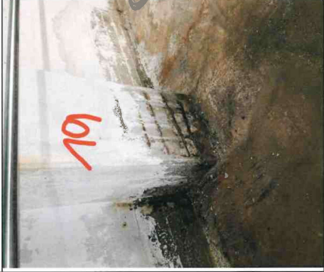
Nr. 19 Sockel/ Stütze