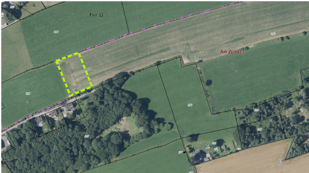
Abb. 4: Luftbildkarte mit Kompensationsfläche 2

Bei der Fläche handelt es sich um eine als Acker genutzte Fläche in der Gemarkung Linderhausen, Flur 12, Flurstück 252 (siehe Abb. 4). Das Gelände fällt von Südosten mit 262 m NHN nach Nordwesten auf unter 258 m NHN. Im Umfeld der Fläche befinden sich Acker- und Grünlandflächen. Am nördlichen und südlichen Rand der Fläche kommen teilweise unterbrochene Heckenstrukturen vor. Weiter südlich befinden sich flächige Laubholzbestände und Brachflächen, die im Landschaftsplan als Geschützter Landschaftsbestandteil festgesetzt sind. Südwestlich verläuft die Chamottestraße mit einigen Wohngebäuden.