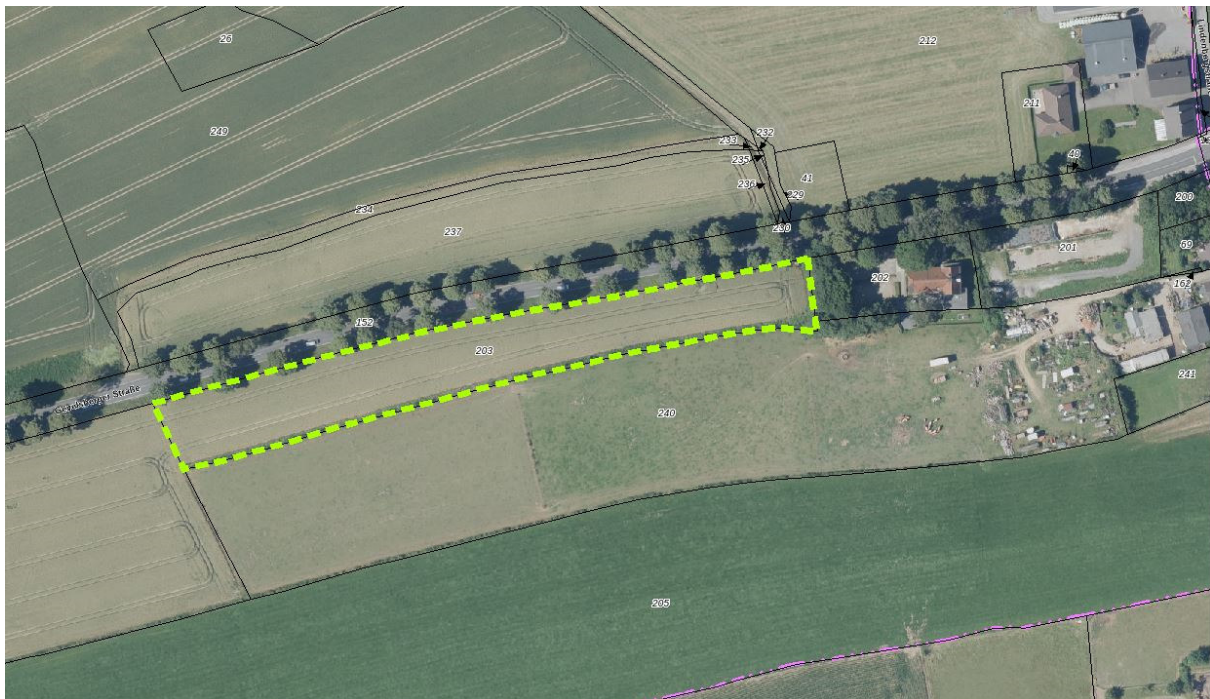
Abb. 2: Luftbilddarstellung der Kompensationsfläche 1

Im Süden grenzen Grünlandflächen an; im Westen liegen ackerbaulich genutzte Flächen. Im Osten befindet sich eine Kapelle.