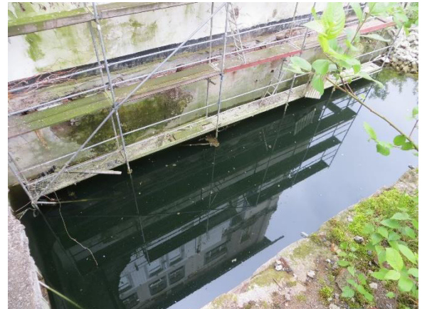
Tümpel im Süden