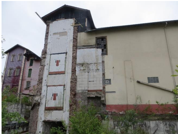
Ansicht südliche Gebäudestrukturen