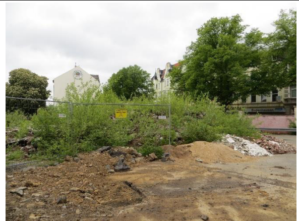
Blick südöstlicher Bereich