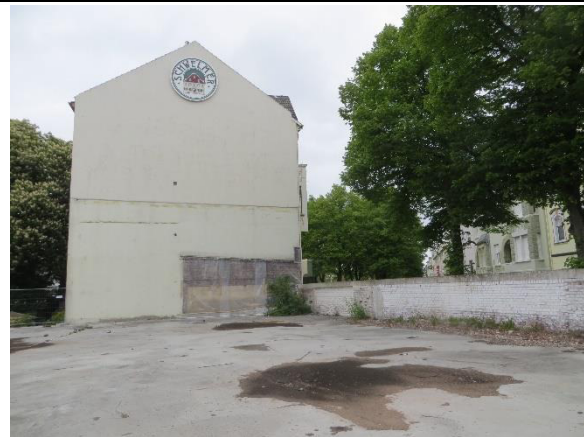
Versiegelter Bereich im Norden mit angrenzender Bebauung außerhalb des Geltungsbereichs