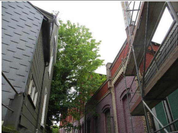
Ansicht südliche Gebäudestrukturen