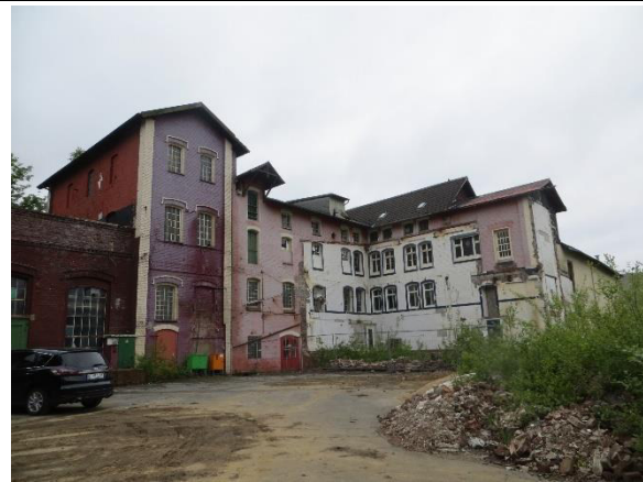
Ansicht südliche Gebäudestrukturen