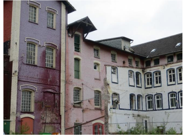
Ansicht südliche Gebäudestrukturen