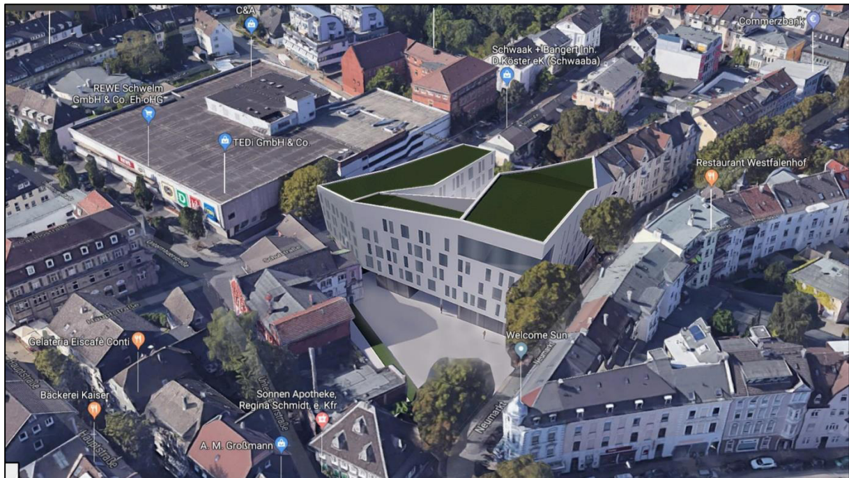
Abbildung 1: Visualisierung der Planung (Heinle Wischer Gesellschaft für Generalplanung mbH; Präsentation Arbeitskreis Zentralisierung am 11. Februar 2019)

Durch die Aufstellung des Bebauungsplanes Nr. 103 „Rathaus - Neue Mitte“ soll eine brachliegende Brauereifläche in der Innenstadt von Schwelm zum Standort eines zentralisierten Rathauses entwickelt werden (vgl. Abb. 1). Nach derzeitigem Planungsstand sollen die denkmalgeschützten Gebäude der ehemaligen Brauerei im Süden und die angrenzenden Straßenbäume erhalten bleiben.