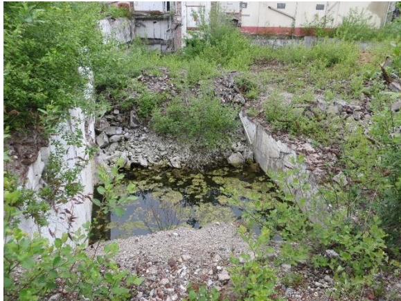
Tümpel in der Mitte des Planungsraumes