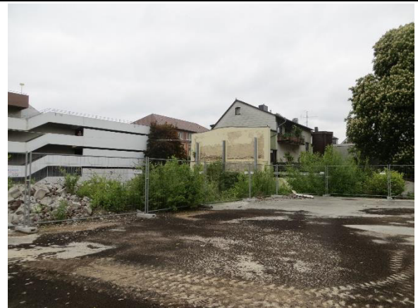
Blick nach Nordwesten mit angrenzender Bebauung außerhalb des Geltungsbereichs