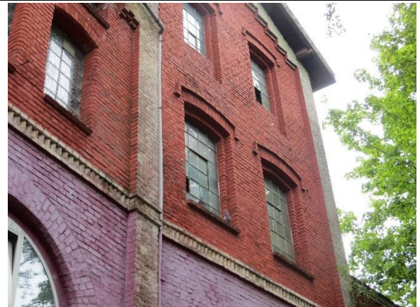
Ansicht südliche Gebäudestrukturen