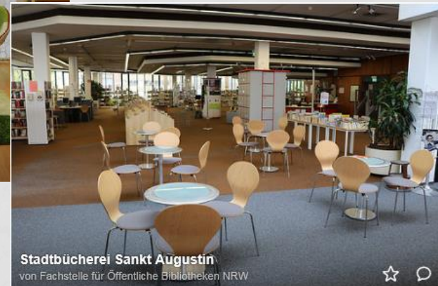
Stadtbücherei Sankt Augustin von Fachstelle für Öffentliche Bibliotheken NRW