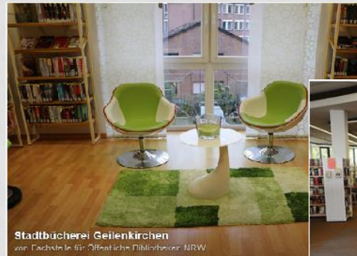
Stadtbücherei Geilenkirchen von Fachstelle für Öffentliche Bibliotheken NRW

Wir bieten: ein Leser-Café und einen Kaffeewagen.