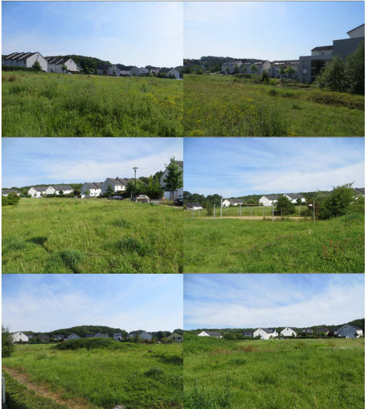
Zentrale Wiese und Umfeld