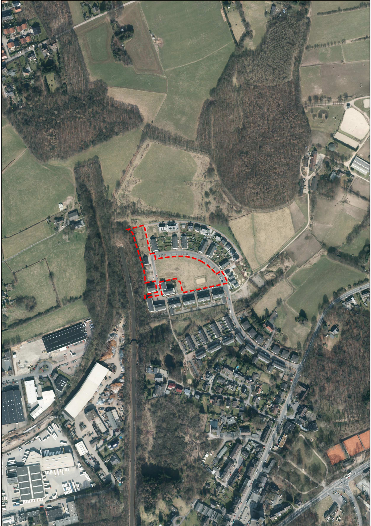
Abb. 2: Luftbildkarte mit Plangebiet