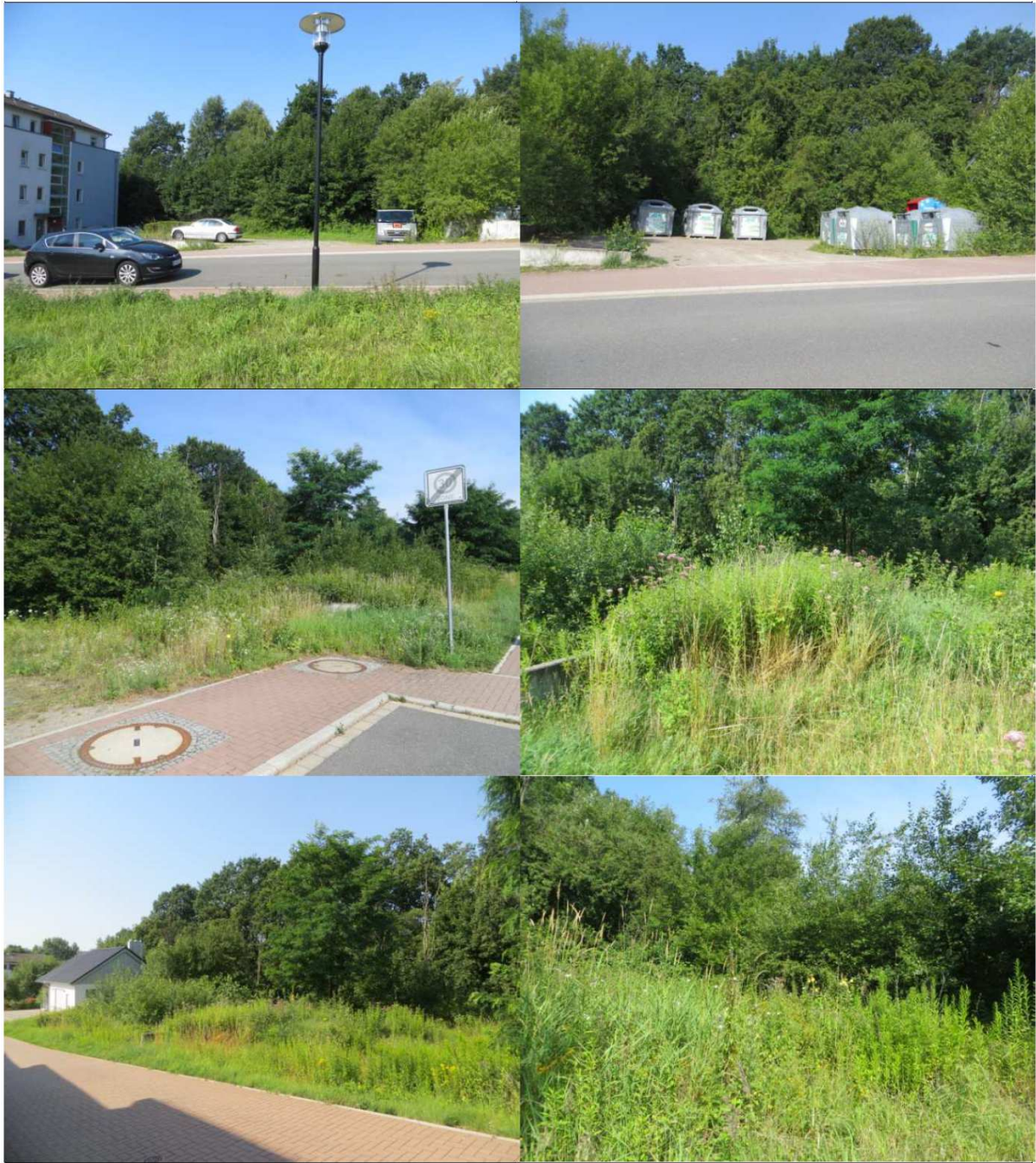
Westliche Teilfläche des Plangebiets (südlich und nördlich Blockheizkraftwerk)