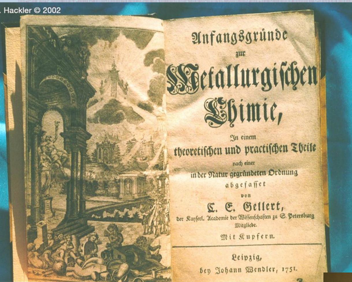
C. E. Gellert, Anfangsgründe zur Metallurgischen Chemie, ... Leipzig (1751).

Sammlungen, Publikationen und Ausstellungen des Stadtarchivs