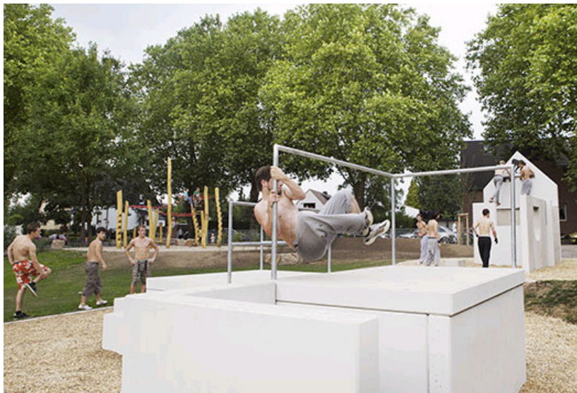
Fun-/Trendsportart „Parkour“ oder „Streetrunning“